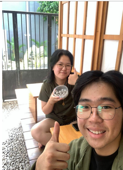
Gambar Informan Ahli 3