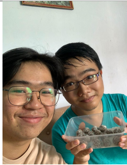
Gambar Informan Ahli 2