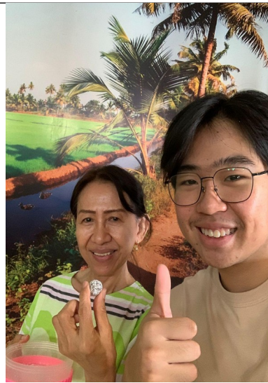
Gambar Informan Ahli 4