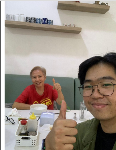
Gambar Informan Ahli 1