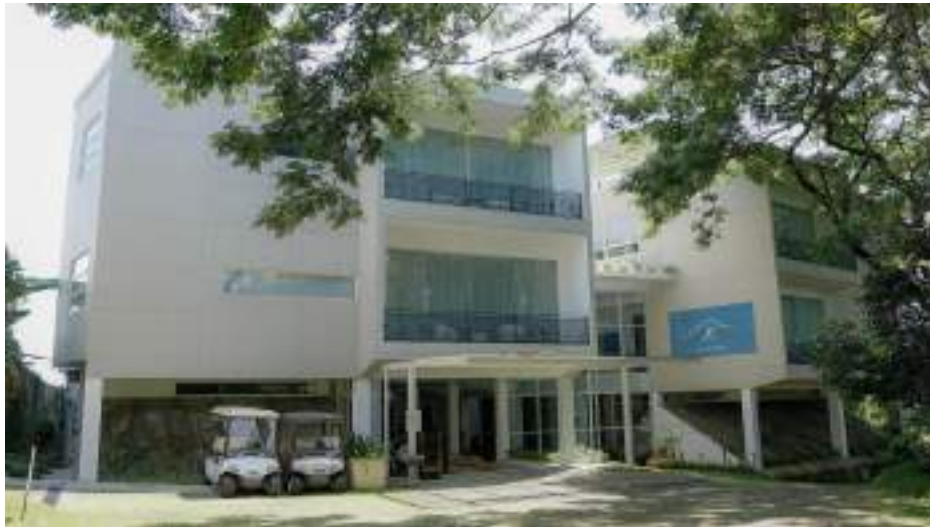
Gambar 4.1 Gedung Lobby K Gallery Hotel

Penelitian dilaksanakan pada K Gallery Hotel yang beralamat Desa Duren Sewu Km No.3, Genengan, Durensewu, Kec. Pandaan, Pasuruan, Jawa Timur 67156. Berikut merupakan gambaran lokasi dan bangunan dari K Gallery Hotel: