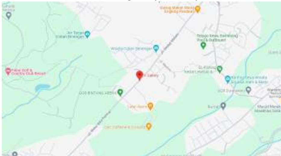
Gambar 4.2 Lokasi K Gallery Hotel

Pada sebuah hotel, dibutuhkanlah sebuah organisasi untuk menjalankan segala kegiatan yang dilakukan pada sebuah hotel. Organisasi ini harus disusun dengan baik, sehingga jalan kerja di dalam hotel bisa lebih efektif, efisien, dan juga memperjelas tanggung jawab tiap individu. Pada K Gallery Hotel pun juga