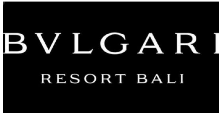
Gambar 4. 1 Logo Bulgari Resort Bali

Bulgari Resort Bali merupakan hotel dan resort yang berada di beberapa negara kota seperti Milan, London, Dubai, Beijing, Shanghai, Paris, Tokyo, Rome, Ranfushi, Miami Beach, Los Angeles, Bali. Tamu Bulgari Resort Bali juga terdapat dari beberapa negara seperti tamu Rusia, China, Arab Saudi, India, US, France, UK, Canada, Japan, Korea dll.