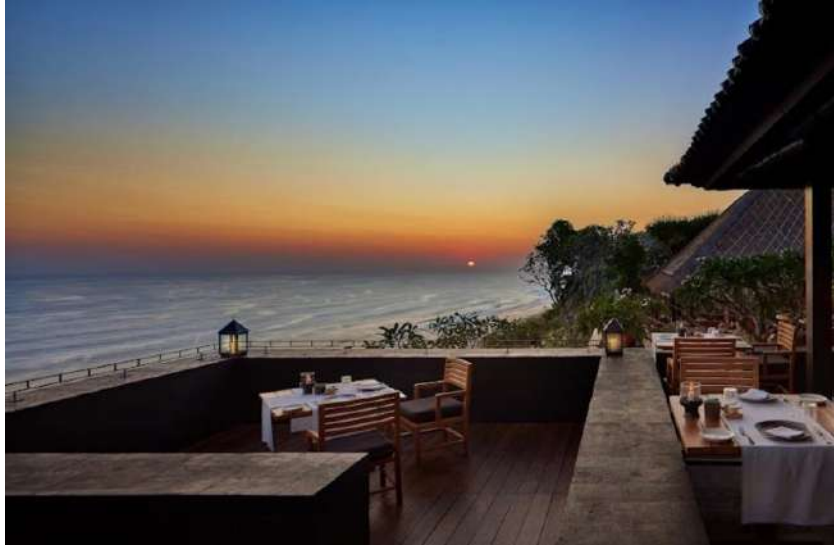
Gambar 4. 2 Sangkar Restaurant