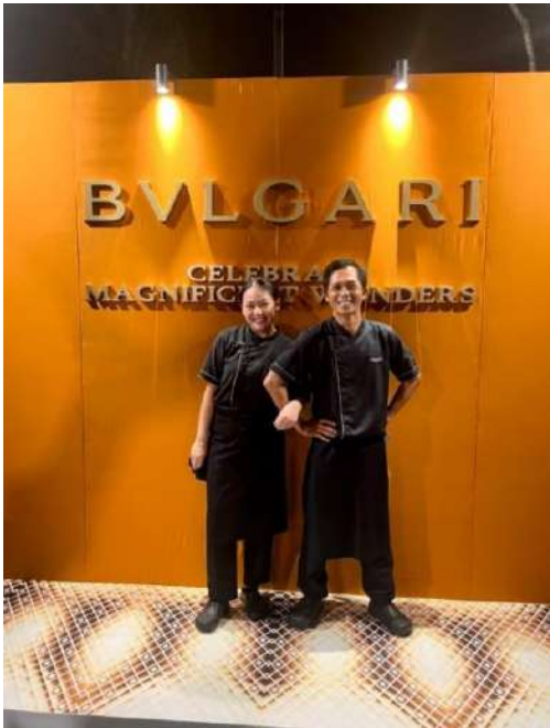
Chef de Cuisine