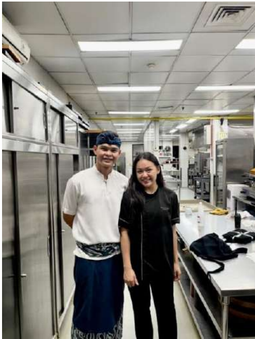
In Villa Dining Server