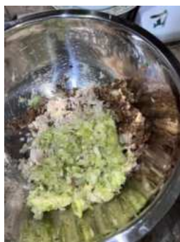
Gambar 3.3 Pencampuran Adonan dengan Bumbu Penyedap