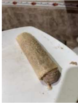
Gambar 3.2 Adonan yang Sudah Siap Dibungkus dengan Kulit Tahu