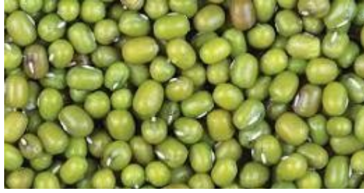
Gambar 2.2 Kacang hijau