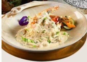
CREAMY BUTTER RICE KING PRAWN Creamy fried butter rice served with king prawn & cream sauce. Available accompanied with Pineapple, Chicken, Beef, or Sausage steak. IDR. 115 K

WARSA, BALAH BRONK RUMAH BELUM TERMAKSI PALAK & SERVICE CHARGE