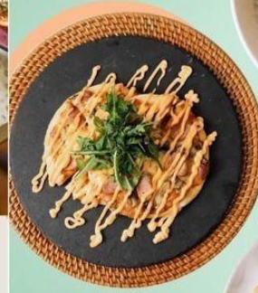
SINGLE DECKER MINI PIZZA Two sheet of crispy pizza with topping of Bacon, Sausage, Sausages, Peperoni, Mushroom, Mozarella Cheese & Cheese Sauce. IDR. 65 K