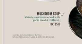
MUSHROOM SOUP Veloute mushroom served with garlic bread & truffle oil. IDR. 65 K