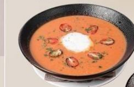
VINE RIPENED TOMATO SOUP Tomato soup infused with lemon grass served with garlic crostini & chives. IDR. 55 K