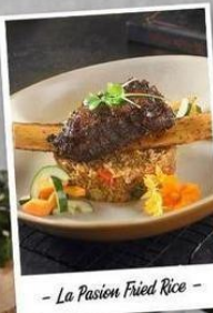
LA PASION FRIED RICE Spicy Indonesian fried rice topped with grilled short ribs & pickles. *Suitable accompanied with Sangre de Torro. IDR. 195 K