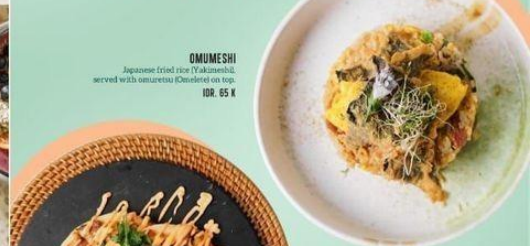
OMUMESHI Japanese fried rice (Yakimeshi), served with omurice (Omelette) on top. IDR. 65 K