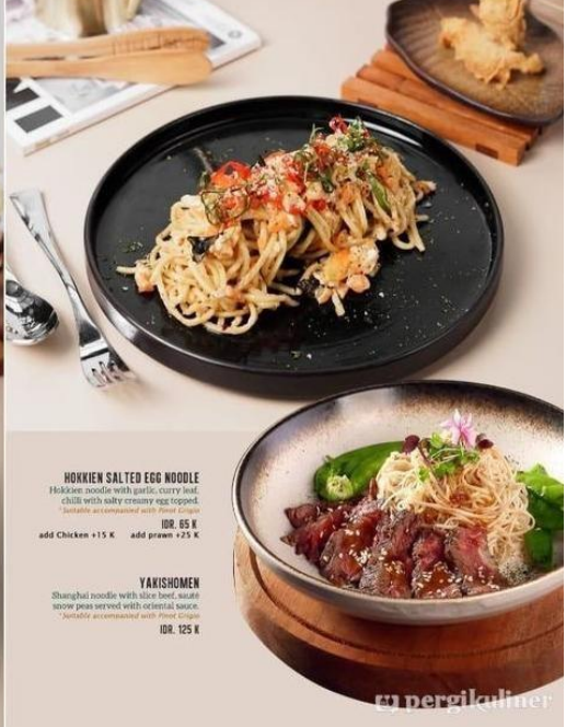
HOKKIEN SALTED EGG NOODLE Hokkien noodle with garlic, curry leaf, chili with salty creamy egg topped. *Suitable accompanied with Pinot Noir. IDR. 85 K add Chicken +15 K add prawn +25 K

MEDIA DALAM RUMAH DAN BELUM TERPAKAI PAJAK & SERVICE CHARGE.