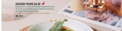
AVOCADO PRAWN SALAD King prawn rolled with baby romaine lettuce & avocado served with spicy cocktail dressing & wrapped with flour tortilla. Available accompanied with Sausage steak. IDR. 65 K