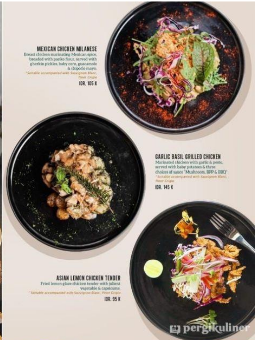
MEXICAN CHICKEN MILANESE Breaded chicken marinating Mexican spices, breaded with panko flour, served with gherkin pickles, baby corn, guacamole & chipotle mayo. *Suitable accompanied with Sangre de Torro, Fried Onion. IDR. 105 K

MEDIA DALAM RUMAH DAN BELUM TERPAKAI PAJAK & SERVICE CHARGE.