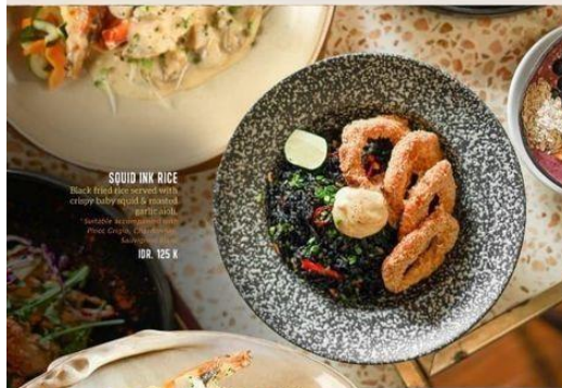
SQUID INK RICE Black fried rice served with crispy baby squid & sunny side-up egg. Available accompanied with Pineapple, Chicken, Beef, or Kakihon. IDR. 125 K