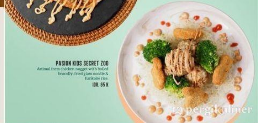
PASION KIDS SECRET ZOO Animal farm chicken nuggets with beaded broccoli, fried glass noodle & Barbecue rice. IDR. 65 K