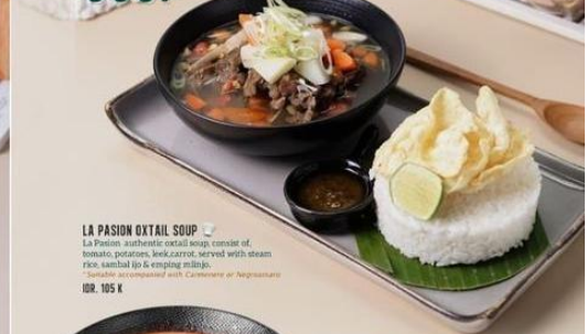
LA PASION OXTAIL SOUP La Pasion authentic oxtail soup, consist of tender oxtail, tomato, potato, beef carrot, served with steam rice, sambal (p) & emping (m) (p). Available accompanied with Camembert or Inagimaru. IDR. 105 K