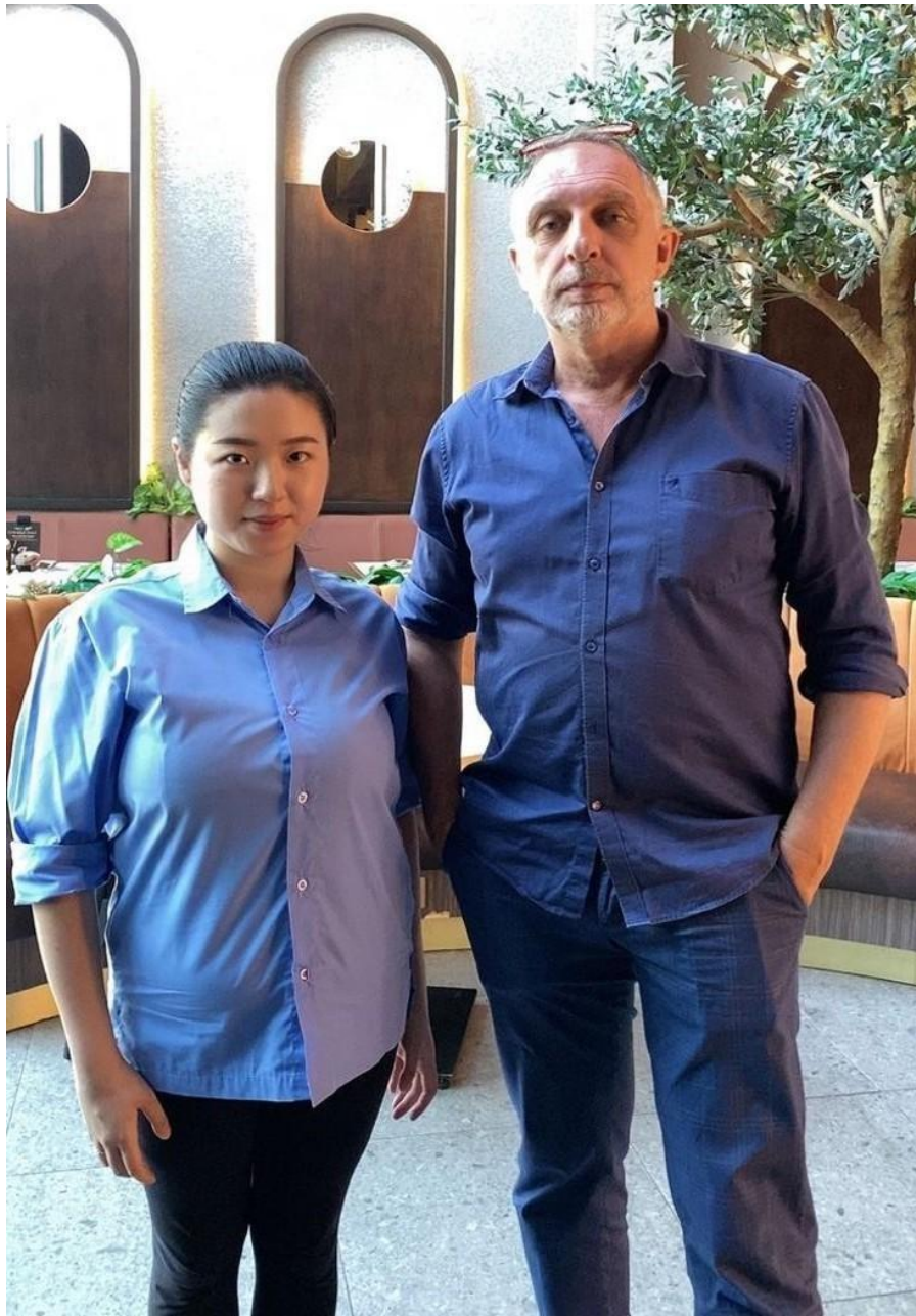
Foto bersama Chef La pasion Surabaya