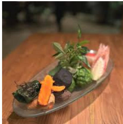
Gambar 1.3 Platter

Mozaic Restaurant menawarkan pelayanan fine dining yang memberikan kesan berbeda saat makan dan juga selalu menggunakan barang mahal seperti foie gras , caviar , dan truffle . Selain itu selalu menggunakan barang lokal dengan maksimal sehingga suatu bahan tidak ada yang terbuang.