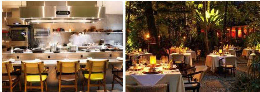
Gambar 1.2 Fasilitas Mozaic Restaurant

Dikarenakan telah berdiri lebih dari dua dekade fasilitas yang ada masih sama yang ada seperti dulu tetapi masih memiliki kualitas yang bagus serta total di Mozaic Restaurant memiliki tiga total dapur yaitu dua dapur baru dan satu dapur lama. Dapur lama digunakan sebagai main kitchen dan satu dapur baru untuk acara yang bersifat privat serta satu lagi untuk kitchen a la carte . Selain itu memiliki banyak chiller dan storage room sehingga dapat menyimpan barang yang banyak. Dan juga ada fasilitas kantin serta loker.