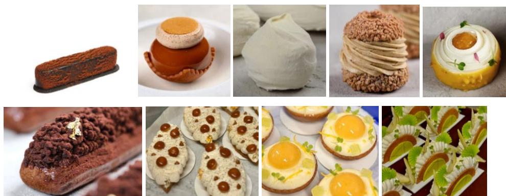
Gambar 1.4 Produk Pastry Kanvaz Patisserie

Kategori viennoiserie di Kanvaz Patisserie mencakup plain croissant , pain au chocolate , almond croissant 2.0 , kouign amann , cronut chocolate , apple chausson , crownie , crookie dan almond choco croissant 2.0 . Kanvaz Patisserie juga mengirim viennoiserie ke beberapa tempat yaitu, Milk and Madu Berawa , Milk and Madu Ubud , Milk and Madu Canggu , Watercress Batu Belig , Watercress Ubud dan The Common Cafe . Macaroon memiliki varian rasa dark chocolate , strawberry , Tahiti vanilla , passion fruit , coffee , pistachio , raspberry and earl grey , peanut caramel dan salted caramel .