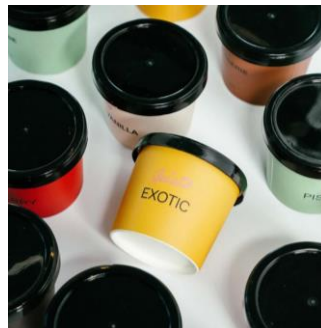
Gambar 1.7 Produk Gelato Kanvaz Patisserie

Kanvaz Patisserie juga menyediakan gelato cup ukuran 120 ml dengan rasa vanilla , chocolate sea salt , strawberry , pistachio dan exotic . Tersedia juga gelato cup ukuran 300 ml memiliki rasa strawberry pistachio , profiterol , exotic baba dan paris to bali . Strawberry pistachio berisikan pistachio ice cream , strawberry sorbet , almond crumble , caramelized pistachio dan chopped pistachio , untuk profiterol berisikan chocolate ice cream , vanilla ice cream , chocolate crumble , choux profiterol . Sedangkan untuk exotic baba , berisikan sorbet , crumble , desiccated coconut dan white chocolate , untuk varian Paris to bali berisikan hazelnut ice cream , hazelnut praline , hazelnut skin dan chop hazelnut .