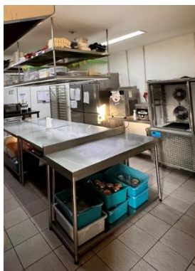
Gambar 1.3 Kitchen Production Pastry

Keamanan di Kanvaz Patisserie dijaga dengan baik, dengan alat pemadam kebakaran yang ditempatkan di lokasi strategis dekat pintu dan tabung gas, memudahkan akses saat darurat. Sistem pembuangan sampah terorganisir dengan memisahkan sampah organik dan non-organik, yang sering didaur ulang, menunjukkan komitmen terhadap keberlanjutan. Kebersihan dapur menjadi prioritas utama, dengan pembersihan rutin setiap minggu untuk menjaga area dapur tetap steril dan higienis. Penyimpanan bahan baku dilakukan secara terorganisir, dengan label untuk memudahkan identifikasi dan mengurangi pemborosan bahan. Fasilitas chocolate room mendukung pembuatan produk cokelat premium untuk dekorasi atau dijual. Dengan fasilitas lengkap dan modern yang memenuhi standar internasional, menciptakan lingkungan kerja yang kondusif dan memberikan pengalaman kuliner yang sempurna bagi pelanggan.