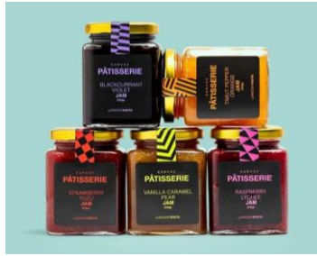
Gambar 1. 8 Produk Jam and Spreads Kanvaz Patisserie