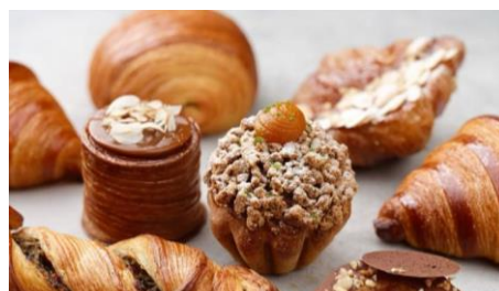
Gambar 1.5 Produk Viennoiserie Kanvaz Patisserie

Kategori viennoiserie di Kanvaz Patisserie mencakup plain croissant , pain au chocolate , almond croissant 2.0 , kouign amann , cronut chocolate , apple chausson , crownie , crookie dan almond choco croissant 2.0 . Kanvaz Patisserie juga mengirim viennoiserie ke beberapa tempat yaitu, Milk and Madu Berawa , Milk and Madu Ubud , Milk and Madu Canggu , Watercress Batu Belig , Watercress Ubud dan The Common Cafe . Macaroon memiliki varian rasa dark chocolate , strawberry , Tahiti vanilla , passion fruit , coffee , pistachio , raspberry and earl grey , peanut caramel dan salted caramel .