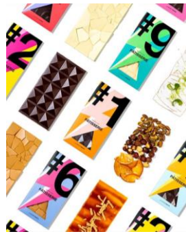
Gambar 1. 6 Produk Chocolate Kanvaz Patisserie

Kanvaz Patisserie juga menyediakan gelato cup ukuran 120 ml dengan rasa vanilla , chocolate sea salt , strawberry , pistachio dan exotic . Tersedia juga gelato cup ukuran 300 ml memiliki rasa strawberry pistachio , profiterol , exotic baba dan paris to bali . Strawberry pistachio berisikan pistachio ice cream , strawberry sorbet , almond crumble , caramelized pistachio dan chopped pistachio , untuk profiterol berisikan chocolate ice cream , vanilla ice cream , chocolate crumble , choux profiterol . Sedangkan untuk exotic baba , berisikan sorbet , crumble , desiccated coconut dan white chocolate , untuk varian Paris to bali berisikan hazelnut ice cream , hazelnut praline , hazelnut skin dan chop hazelnut .