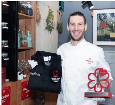
Gambar 1.1 Chef Owner

Pengunjung yang ingin datang untuk menikmati makanan dan pengalaman di restoran ini memiliki berbagai opsi makanan set menu yang telah disediakan, antara lain paket lunch , dinner , dan memiliki opsi jus atau wine pairing masing-masing. Visi dan Misi dari restoran ini adalah menggunakan bahan lokal korea dengan teknik dari seluruh dunia dan selalu menyajikan makanan dan memberikan pengalaman fine dining terbaik yang konsumen pernah miliki dan dapat dikenang selamanya