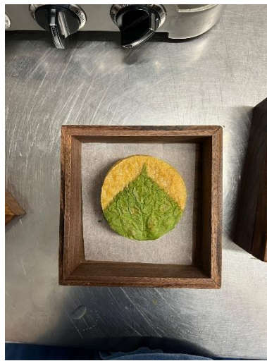
Gambar 2.1 Tortilla Mungbean

Selama 3 bulan bekerja di Restaurant EVETT, penulis bekerja di dalam mid-course section atau fish station . Penulis diberi kepercayaan penuh untuk melakukan prep baik dalam skala besar maupun kecil mulai dari membuat crab broth , membuat mungbean tortilla dough , hingga membuat juice pairing dalam mid-course section .