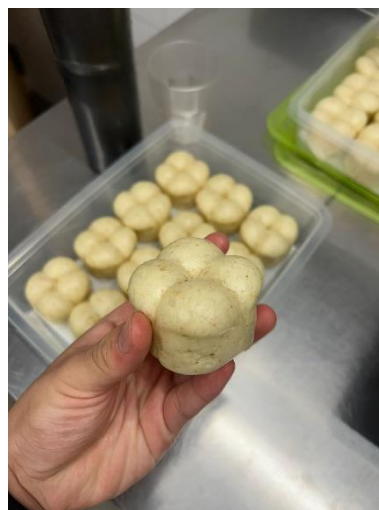
Gambar 3.2 Steam Nuruk Bread