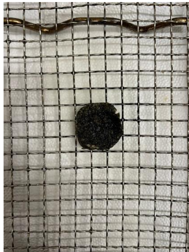
Gambar 3.1 Kim Bugak

Proses magang berjalan berjalan lancar sesuai dengan target awal penulis datang ke Korea Selatan yaitu belajar bagaimana cara para chef bekerja dan belajar untuk mengikuti standar kerja yang begitu disiplin dan teratur. Terdapat perkembangan yang signifikan setiap harinya kepada penulis. Mulai dari hard skill cara set up preparasi, cara membuat makanan dengan teknik-teknik baru hingga soft skill yang terus terlatih setiap hari seperti berkomunikasi dengan bahasa inggris yang baik dan benar.