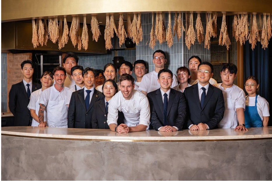
Gambar 1.4 Restaurant EVETT Team