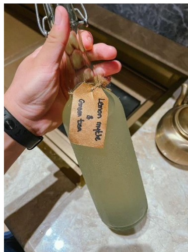
Gambar 2.3 Juice Pairing in Mid-Course Section