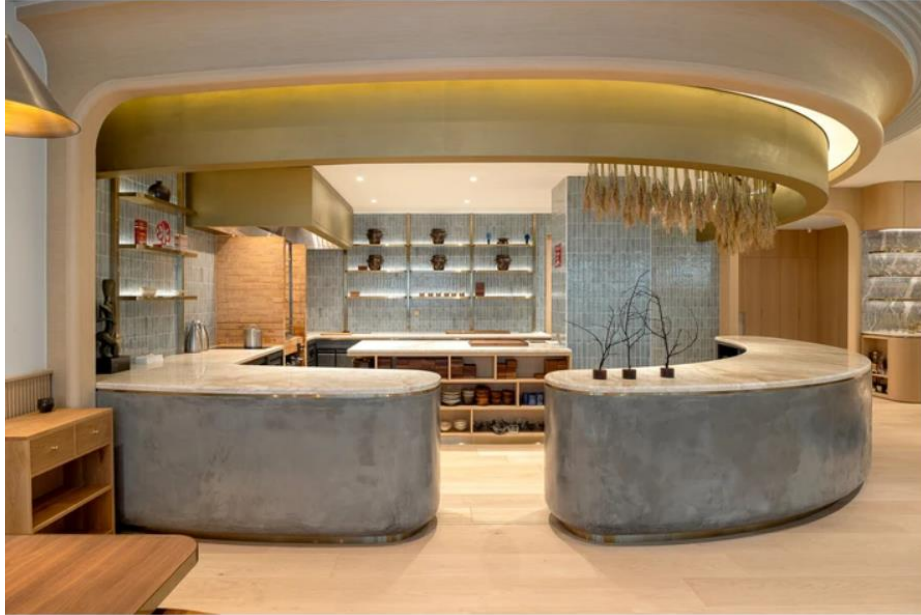
Gambar 1.2 Service Kitchen

untuk menyimpan bahan-bahan kering. Selain itu restoran ini juga memiliki service kitchen yang lengkap dan berstandar industri, di lengkapi dengan blast freezer , dan drawer chiller di setiap sectionnya dan juga peralatan yang lengkap untuk tim servis dalam waktu operasionalnya.