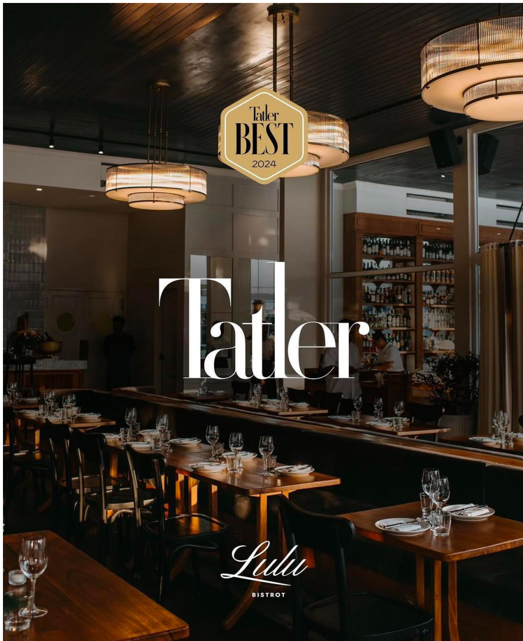
Gambar 1.2 Tatler Best 2024

selebrasi orang lokal dengan bahan musiman, dan beberapa produk wine terbaik di dunia.