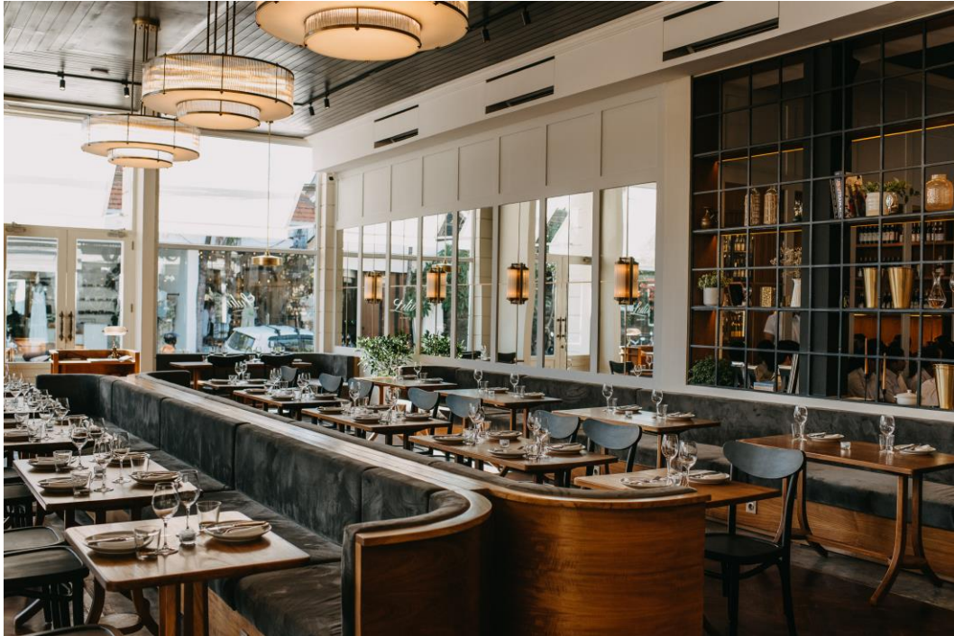
Gambar 1.3 Lulu Dining Room