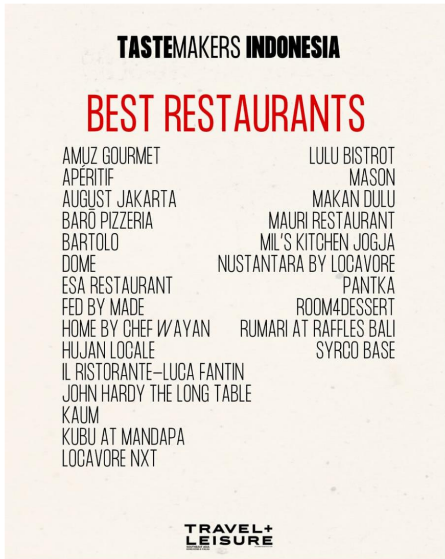
Gambar 1.3 Best Restaurant Indonesia List by Travel Leisure 2024