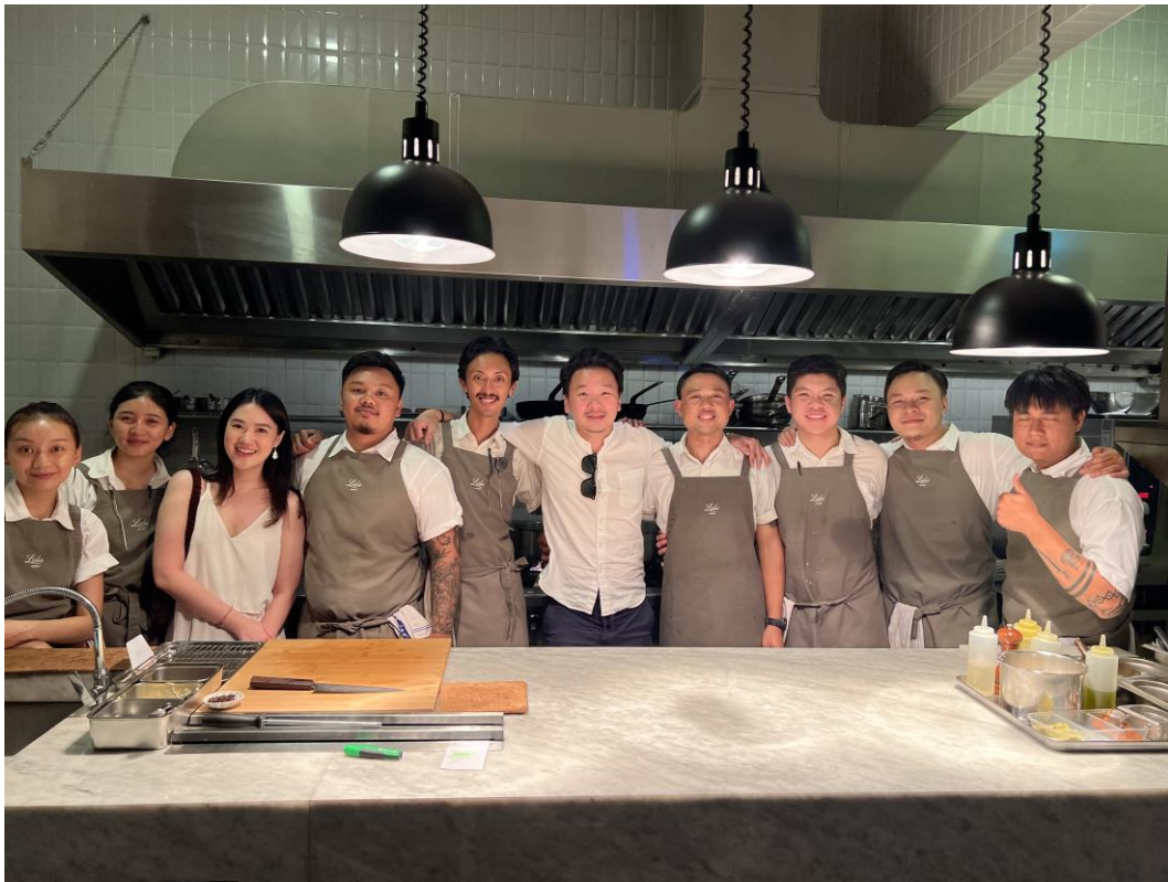
Gambar 1.1 Lulu Bistrot Team

terinspirasi dari kafe-kafe besar Paris dengan energi kreatif dan suasana santai, klasik tetapi tetap kontemporer, halus namun hidup sekaligus.