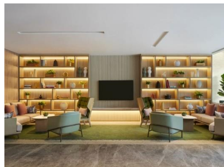
Gambar 1.27 Mini library