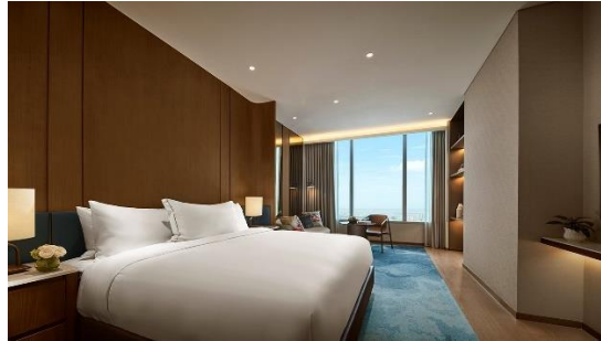
Gambar 1.9 Pan Pacifik Suite

malam atau rapat informal. Sama seperti semua kamar pacific club, Pan Pacifik suite juga diberikan akses breakfast dan lounge. Untuk fasilitas kamar masih sama seperti kamar pacific club lainnya.