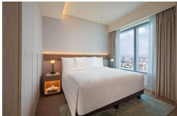
Gambar 1.13 One Bedroom Premier Suite

One Bedroom Premier Suite menawarkan kamar seluas 65 meter persegi yang juga sama seperti kamar lainnya, memiliki ruang tamu dan ruang makan yang terpisah, dapur mini yang sudah lengkap dengan kompor, kulkas, microwave, westafel dan sekaligus mesin cuci dan pengering pakaian. Untuk fasilitas kamar dan kamar mandi masih sama dengan kamar lainnya dan dengan Kasur pilihan king atau twin bed , dan juga walk in shower serta bathup.