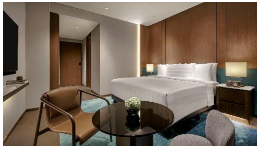
Gambar 1.1 Deluxe Room

Tipe kamar deluxe di pan pacific Jakarta dirancang untuk memberikan kenyamanan bagi para tamu. Dengan luas antara 26 hingga 29 meter persegi, kamar ini menawarkan pilihan tempat tidur king size atau twin beds , serta pemandangan kota Jakarta. Fasilitas kamar yang ditawarkan ialah televisi, wifi, brankas, sofa bean, turndown service , perlengkapan kamar mandi, hair dryer , mini bar , amenities seperti the dan kopi, serta disediakan jam alarm dan speaker Bluetooth.