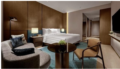
Gambar 1.2 Premier Room

Kamar premier di pan pacific Jakarta dirancang dengan luas 35 meter persegi dan memberikan ruang yang cukup untuk bersantai dan bekerja. Fasilitas kamar yang diberikan sama dengan deluxe room, perbedaannya ialah tamu yang menginap di kamar premier juga memiliki opsi untuk meningkatkan pengalaman menginap mereka dengan memilih Pan Pacific club premier room , yang menawarkan akses eksklusif ke pacific club lounge. Disana tamu dapat menikmati berbagai macam minuman seperti alcohol, teh atau kopi, serta kudapan-kudapan seperti canape , dessert , cold cuts , dan buah-buahan sambil menikmati pemandangan di lantai 90.