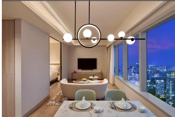
Gambar 1.14 One Bedroom Executive Suite

makan yang terpisah, dapur mini yang sudah lengkap dengan kompor, kulkas, microwave, westafel dan sekaligus mesin cuci dan pengering pakaian. Untuk fasilitas kamar dan kamar mandi masih sama dengan kamar lainnya dan dengan Kasur pilihan king atau twin bed , dan juga walk in shower serta bathup.