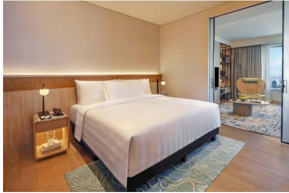
Gambar 1.12 One Bedroom Deluxe Suite

yang terpisah, dapur mini yang sudah lengkap dengan kompor, kulkas, microwave, westafel dan sekaligus mesin cuci dan pengering pakaian. Untuk fasilitas kamar dan kamar mandi masih sama dengan kamar lainnya dan dengan Kasur pilihan king atau twin bed , dan juga walk in shower serta bathup.