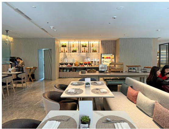
Gambar 1.25 Resident Lounge

Berbeda dengan Pan Pacifik Jakarta dan Keyaki Japanese, Parkroyal hotel sendiri menawarkan fasilitas restoran yang dirancang untuk memberikan pengalaman bersantap yang nyaman dan berbagai macam pilihan makanan bagi para tamu. Salah satu fasilitas yang disediakan ialah resident lounge , yang menyajikan berbagai pilihan hidangan local dan international. Para tamu dapat menikmati sarapan serta aneka minuman dan makanan ringan sepanjang hari. Selain area makan, lounge juga dilengkapi dengan board room yang bisa dijadikan tempat pertemuan/meeting dan mini library sebagai tempat bersantai.