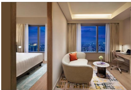
Gambar 1.11 One Bedroom Suite

One Bedroom Suite milik Parkroyal hotel dirancang dengan luas kamar 50 meter persegi, suite ini menyediakan ruang yang luas dengan tata letak yang memisahkan area kerja dan area tidur untuk menjaga privasi dan kenyamanan tamu. Area kerja dilengkapi dengan meja khusus yang ideal bagi tamu bisnis yang memerlukan tempat untuk bekerja. One Bedroom Suite juga dilengkapi dengan ruang tamu dan ruang makan yang terpisah, dapur mini yang sudah lengkap dengan kompor, kulkas, microwave, westafel dan sekaligus mesin cuci dan pengering pakaian. Tamu juga dapat memilih tempat tidur antara king atau twin bed , dan juga fasilitas kamar mandi yang sudah dilengkapi walk in shower , Bathup , dan perlengkapan mandi lainnya.