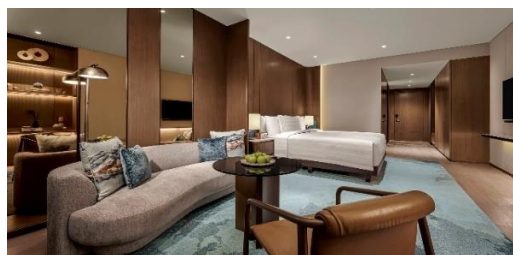
Gambar 1.3 Executive Room

Kamar executive di Pan Pacifik dirancang dengan luas 42 meter persegi dan dilengkapi dengan tempat tidur king-size , tersedia juga pilihan bantal hipoalergenik dan duvet berbulu halus. Kamar ini juga menyediakan fasilitas seperti minibar, smart tv , dan akses ke club lounge. Fasilitas kamar mandi juga tersedia lengkap dengan bathub, shower, perlengkapan kamar mandi, dan ruang rias. Tamu yang menginap di kamar ini mendapatkan akses ke pacific club lounge.