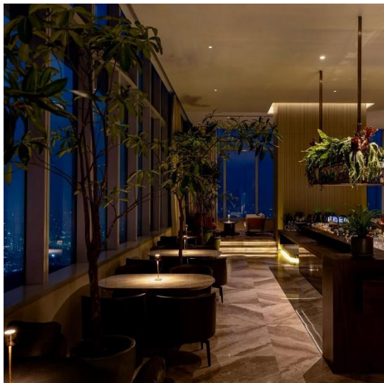
Gambar 1.24 Eden Bar

Selain keyaki japanases restaurant, pan pacific juga menghadirkan eden bar yang merupakan lounge dengan tema botani yang menawarkan suasana santai di area luar ruangan. Eden bar memberikan pemandangan indah dari lantai 90 dan menciptakan suasana nyaman untuk bersantai sembari menikmati aneka koktail, minuman signature, dan cemilan.