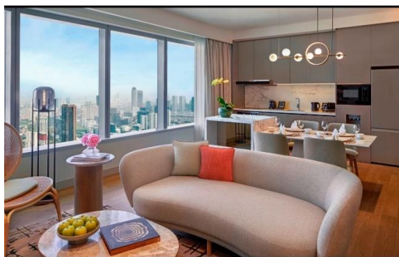
Gambar 1.15 Two Bedroom Deluxe Suite

Two Bedroom Deluxe Suite dirancang dengan kamar seluas 90 meter persegi dan memiliki 2 kamar tidur yang masing-masing dilengkapi king atau twin bed, ruang tamu dan ruang makan yang terpisah, dapur mini yang sudah lengkap dengan kompor, kulkas, microwave, westafel dan sekaligus mesin cuci dan pengering pakaian. Untuk fasilitas kamar dan kamar mandi masih sama dengan kamar lainnya dan dengan Kasur pilihan king atau twin bed , dan juga walk in shower serta bathup.