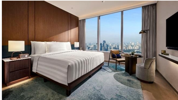
Gambar 1.4 Pacific Club Deluxe

Kamar Pacific club deluxe dirancang dengan luas kamar 28 meter persegi. Dari segi fasilitas kamar sama seperti kamar-kamar lainnya hanya saja ada keunggulan utama yang didapat dari pacific club deluxe adalah sudah termasuk dengan breakfast dan akses ke pacific club lounge dan afternoon tea di lantai 90. Fasilitas lainnya adalah termasuk bantal hipoalergenik, setrika, papan setrika, sandal, perlengkapan mandi dari merek ternama Balmain serta layanan late check out .