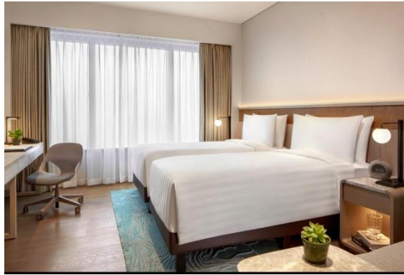
Gambar 1.17 Two Bedroom Corner Suite