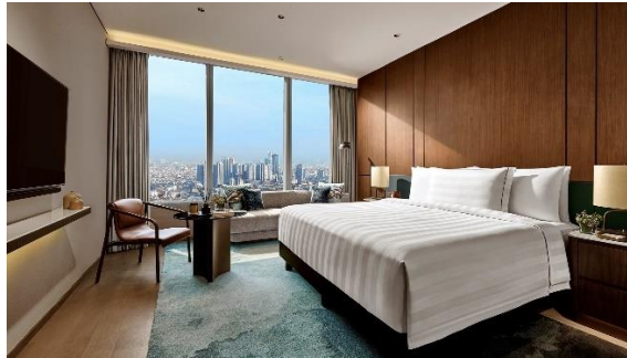
Gambar 1.5 Pacific Club Premier