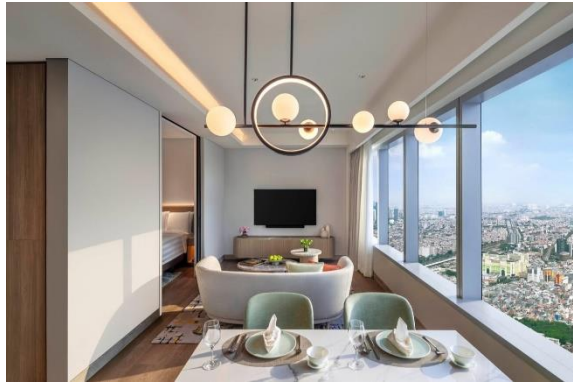
Gambar 1.10 Studio Suite