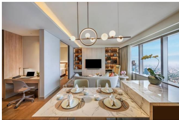
Gambar 1.16 Two Bedroom Deluxe Corne Suite

Two Bedroom Deluxe Corner Suite merupakan kombinasi dari One Bedroom suite seluas 50 meter persegi dan Deluxe Suite seluas 60 meter persegi, memberikan total luas sekitar 110 meter persegi. Suite ini dilengkapi dengan dua tempat tidur king size , bathtub , dan rain shower . Adapun juga disediakan fasilitas elektronik dan kamar mandi yang sama seperti kamar lainnya, ruang tamu dan ruang makan yang terpisah, dapur mini yang sudah lengkap dengan kompor, kulkas, microwave, wastafel dan sekaligus mesin cuci dan pengering pakaian.