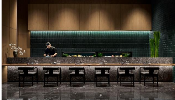
Gambar 1.23 Robotayaki

Robotayaki atau Robata juga tersedia di restaurant dan merupakan alat pemanggang tradisional jepang untuk memanggang daging atau ikan dengan api langsung, memberikan cita rasa khas makanan jepang.