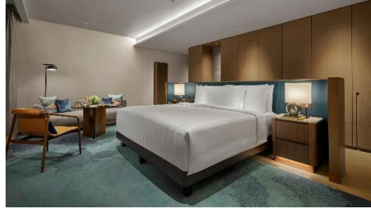
Gambar 1.7 Junior Suite

memberikan akses langsung ke berbagai fasilitas hotel termasuk restaurant dan lounge. Untuk fasilitas kamar masih sama seperti kamar pacific club lainnya.