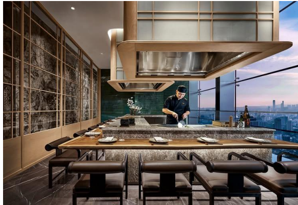
Gambar 1.19 Teppanyaki

Tersedianya area Teppanyaki yang menjadi salah satu daya tarik utama Keyaki restaurant di mana chef dapat memasak langsung didepan tamu diatas meja teppanyaki yang dilengkapi dengan pemanggang datar. Ini memungkinkan para tamu untuk menikmati langsung pertunjukkan interaktif dari chef sambil menyaksikan proses memasak.