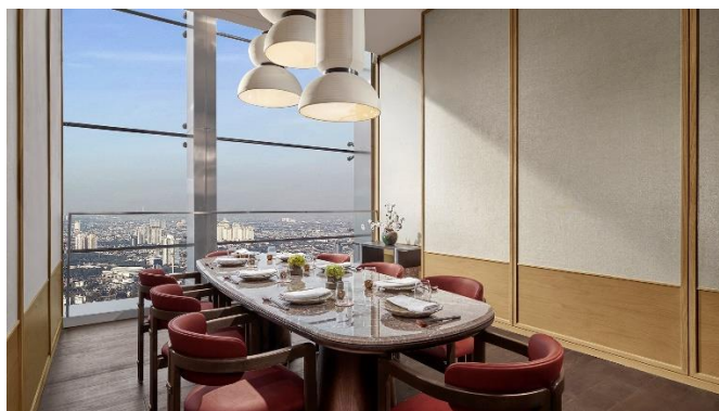
Gambar 1.20 Private Dining Room

Keyaki restaurant menyediakan Privat Dining Room atau ruang makan privat yang dapat digunakan untuk acara khusus atau pertemuan bisnis ( Meeting ), ruang ini memberikan privasi dan kenyamanan ekstra bagi para tamu.