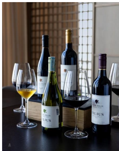
Gambar 1.22 Wine and Sake Selection

Keyaki restaurant juga dikenal memiliki wine dan sake selection yang berkualitas untuk melengkapi hidangan Jepang yang disajikan. Keyaki juga memiliki Sommelier yang profesional dalam memberikan rekomendasi pasangan minuman yang tepat untuk setiap hidangan.