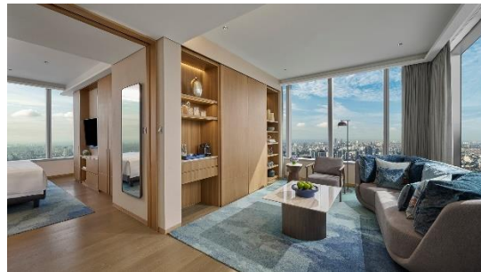
Gambar 1.8 Premier Suite

Premier suite di Pan pacific hotel dirancang dengan luas kamar 62 meter persegi, menawarkan ruang yang sangat luas dan terdiri dari kamar tidur utaman yang dilengkapi dengan tempat tidur king size , serta ruang tamu yang terpisah memberikan ruang tambahan bagi tamu untuk bersantai dan bekerja. Sama seperti semua kamar pacific club, premier suite juga diberikan akses breakfast dan lounge. Untuk fasilitas kamar masih sama seperti kamar pacific club lainnya.