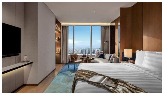
Gambar 1.6 Pacific Club Executive

Kamar Pacific Club Premier dirancang dengan luas kamar 42 meter persegi, dilengkapi dengan king size bed, pilihan bantal hipoalergenik dan duvet berbulu halus dan nyaman. Fasilitas elektronik yang diberikan ialah smart tv 65 inch , soundbar bluetooth , dan wifi gratis. Tersedia pula fasilitas amenities showers, bathub , jubah mandi, sandal, sabun bermerek Balmain , setrika dan papan setrika, serta layanan late checkout . Tamu yang menginap dikamar ini juga mendapatkan akses untuk breakfast dan akses eksklusif ke Pacific Club Lounge dimana tamu dapat menikmati cocktail dan canape night , serta afternoon tea .