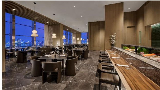
Gambar 1.21 Sushi Bar

Restoran ini juga memiliki sushi bar di mana tamu dapat menyaksikan chef yang terlatih menyiapkan sushi dan sashimi secara langsung. Bahan yang digunakan pun merupakan bahan yang segar dan diimpor langsung dari Jepang atau sumber laut berkualitas lainnya. Sushi bar Keyaki juga memberikan pengalaman yang lebih personal bagi pecinta makanan Jepang.