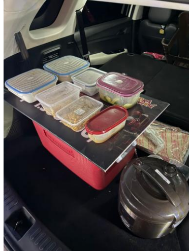
Gambar 3.1 Layout Mobil Almaz