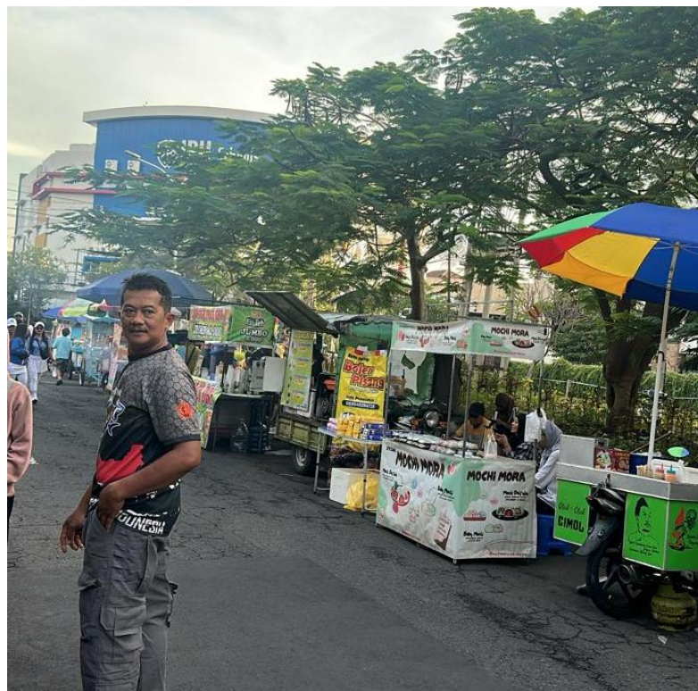
Lampiran 6: Pasar Malam Di Hajatan