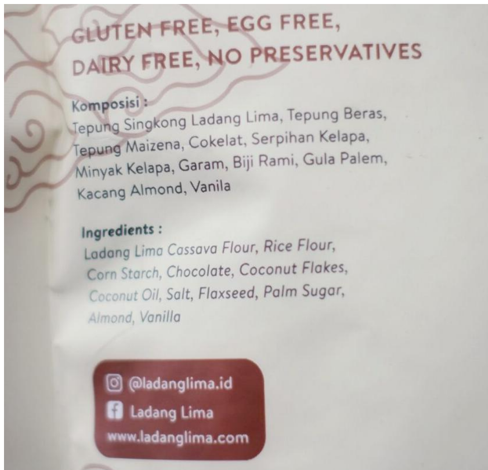
Lampiran 5: Komposisi bahan dalam Brownies Crispy Gluten-free (Blackthins Ladang Lima)