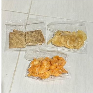
Lampiran 1: Gambar Produk yang Diambil Pada Awal Penelitian dengan 4 Jenis Kemasan yang Berbeda