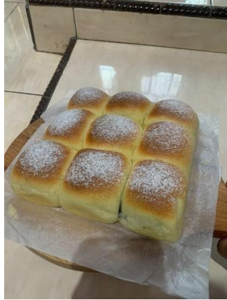
Gambar 10.1 Soft Milk Bun