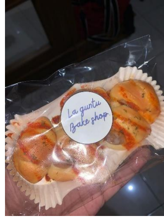
Gambar 10.2 Sausage Bun