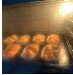
Gambar 3.6 sausage bun didalam oven