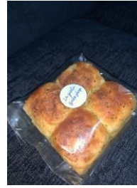
Gambar 3.10 Bentuk Garlic Chesse Bun