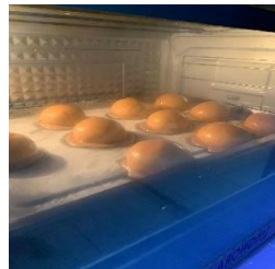
Gambar 3.2 coffe bun didalam oven