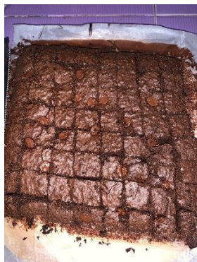
Gambar 10.5 Fudgy Chocolate Brownies