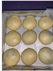
Gambar 3.7 bentuk soft milk bun