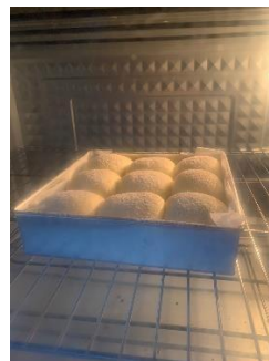
Gambar 3.8 Soft milk bun didalam oven

8. Masukkan ke oven dan bake 170 c selama 20-25 menit