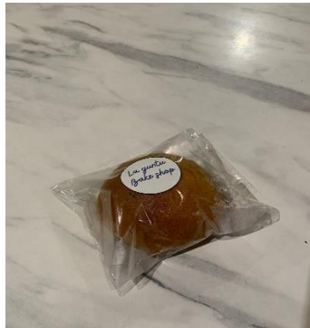
Gambar 10.3 Coffe Bun