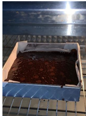
Gambar 3.4 Bentuk dimasukkan ke oven

5. Masukkan ke loyang dan bake di suhu 165 c selama 30-35 menit