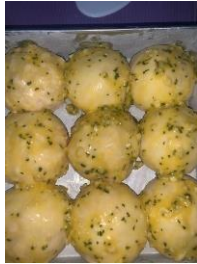
Gambar 3.9 Diolesin garlic Butter