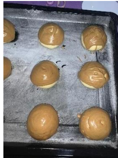
Gambar 3.1. Coffe Bun didiamkan