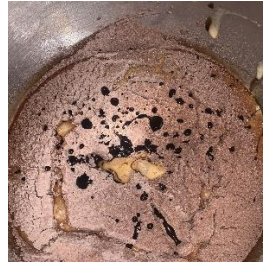
Gambar 3.3 Bahan dicampurkan semua

5. Masukkan ke loyang dan bake di suhu 165 c selama 30-35 menit