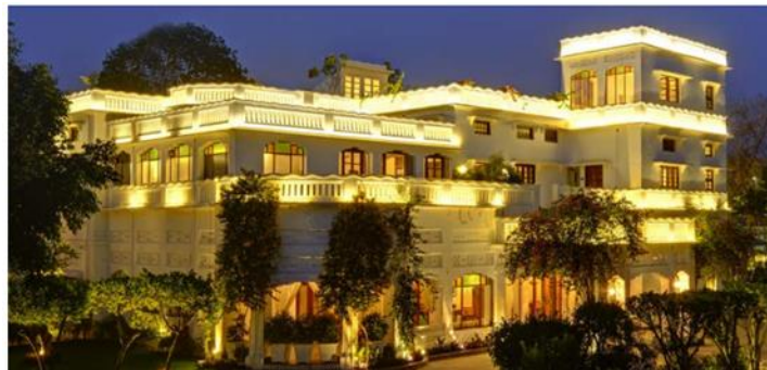
Gambar 1.2 Lebua Lucknow Uttar Pradesh, India.