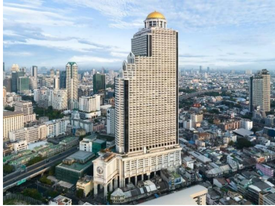
Gambar 1.5 Lokasi Lebua Hotel & Resort At State Tower Bangkok, Thailand Pada Gambar.