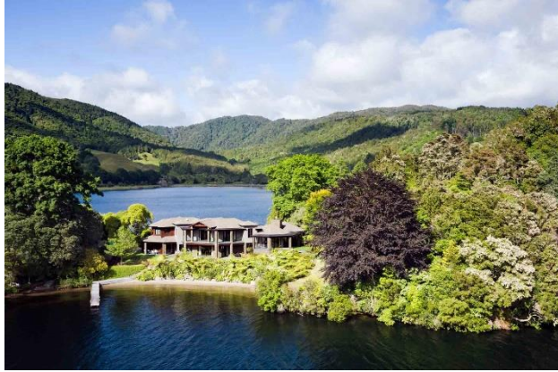
Gambar 1.3 Lebu Lake Okareka Lodge Rototua, New Zealand.