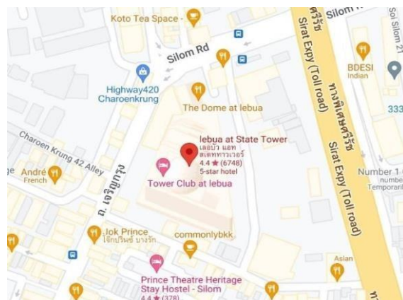
Gambar 1.4 Lokasi Lebua Hotel & Resort At State Tower Bangkok, Thailand pada Maps

Penulis melaksanakan program magang di Breeze, Lebua Hotels and Resort at State Tower ini adalah hotel bintang 5 yang berada di Bangkok, Thailand. Hotel ini bersebelahan dengan Sungai Chao Phraya di Silom Road di Distrik Bang Rak, Bangkok, Thailand. Penulis melakukan program magang selama 6 bulan, dimulai dari tanggal 19 Juli 2023 sampai dengan 19 Januari 2024. Hari kerja yang ditetapkan oleh Breeze Restaurant adalah 6 hari kerja dan 1 hari libur setiap minggunya, dan untuk jam kerjanya adalah 8 jam kerja dan 1 jam istirahat. Alasan penulis memilih melaksanakan program magang di Breeze, Lebua Hotel & Resort at State Tower, karena Lebua Hotels & resort at State Tower ini adalah hotel mewah all-suite berbintang 5 yang berkembang pesat dan mengoperasikan hotel khas. Hotel ini juga memiliki banyak restoran berbintang michelin.