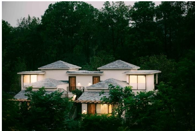
Gambar 1.1 Lebua Corbett Uttarkhand, India.