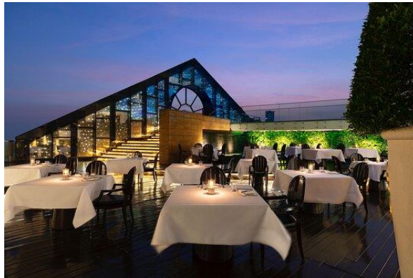
Gambar 1.6 Breeze Restaurant Bangkok, Thailand Pada Gambar.