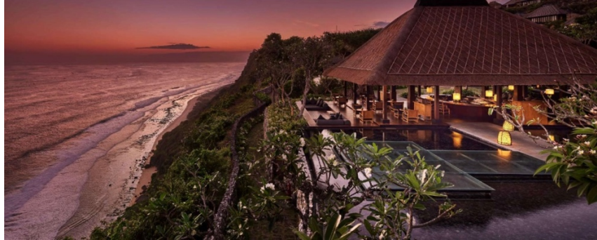
Gambar 1.7 The Bar

kekuatan alam. Menu yang menawarkan berbagai jenis cocktail, wines, canape, pizza yang semuanya sesuai dengan tradisi aperitivo Italia. The Bar buka dari jam 10:00 – 01:00.