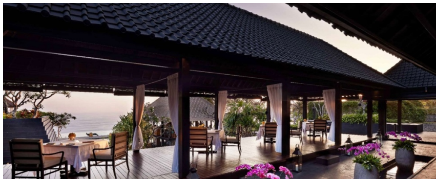
Gambar 1.4 IL Ristorante

IL Ristorante ditunjuk sebagai restoran hotel terbaik di dunia oleh forum makanan dan minuman internasional. 10 restoran hotel terbaik tahun 2011 oleh Villeroy & Boch 2013. IL Ristorante memiliki gaya bale terbuka yang berlokasi di atas tebing Pecatu yang memiliki panorama Indian Ocean yang indah, dibuka pada malam hari mulai pukul 18:30 – 23:00, dengan kapasitas hanya sampai 36 orang. Restoran ini menyajikan Contemporary Interpretation of Classical Italian Cuisine , yang dimasak dan diplating oleh Italian Chef yang sudah berpengalaman.