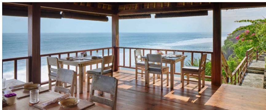
Gambar 1.6 La Spiaggia

La Spiaggia terletak di bawah tebing, di hamparan pantai pasir putih Bulgari Resort Bali. La Spiaggia juga menawarkan grilled seafood terbaik dan segar di Bali atau salah satu cocktails yang terkenal yaitu Herbojito cocktails sambal menikmati angin laut yang sejuk dengan pemandangan Samudera Hindia. La Spiaggia ini tersedia khusus tamu Bulgari Resort Bali. Restaurant ini buka untuk lunch pada pukul 12:00 – 17:00, dan hanya dapat di akses dengan menggunakan inclinador lift .