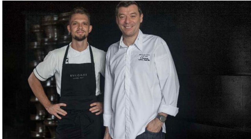
Gambar 1.5 Chef IL Ristorante

La Spiaggia terletak di bawah tebing, di hamparan pantai pasir putih Bulgari Resort Bali. La Spiaggia juga menawarkan grilled seafood terbaik dan segar di Bali atau salah satu cocktails yang terkenal yaitu Herbojito cocktails sambal menikmati angin laut yang sejuk dengan pemandangan Samudera Hindia. La Spiaggia ini tersedia khusus tamu Bulgari Resort Bali. Restaurant ini buka untuk lunch pada pukul 12:00 – 17:00, dan hanya dapat di akses dengan menggunakan inclinador lift .