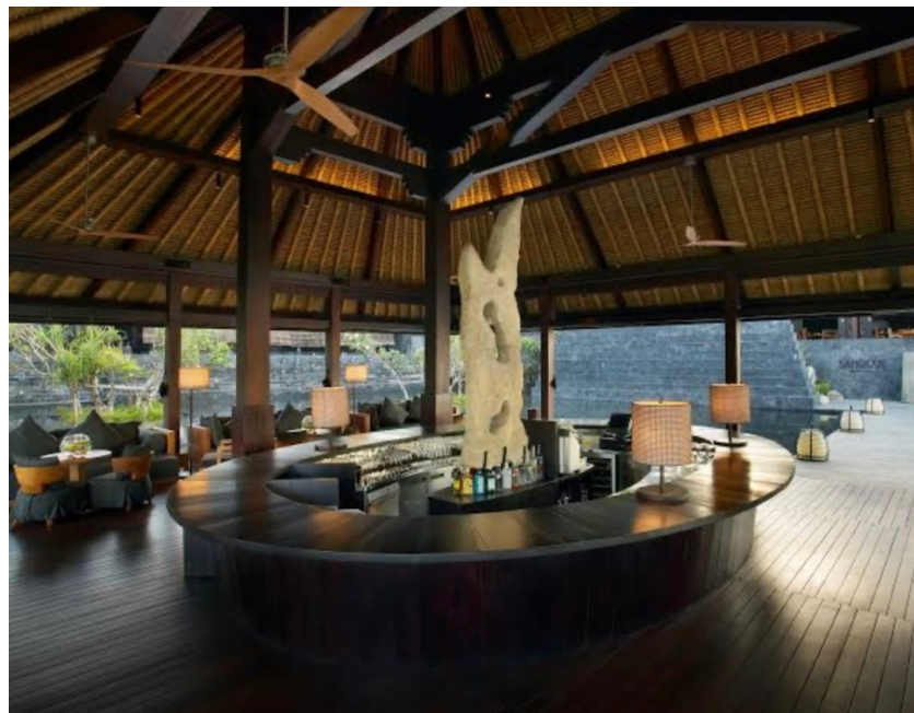
Gambar 1.8 Counter The Bar

Bulgari Resort Bali juga terdapat 2 kitchen yaitu Main Kitchen dan Pastry Kitchen. Di dalam Main Kitchen terdapat tiga section yaitu Cold, Western, dan Asian section. Dan di dalam pastry kitchen terdapat dua section yaitu pastry dan bakery section.