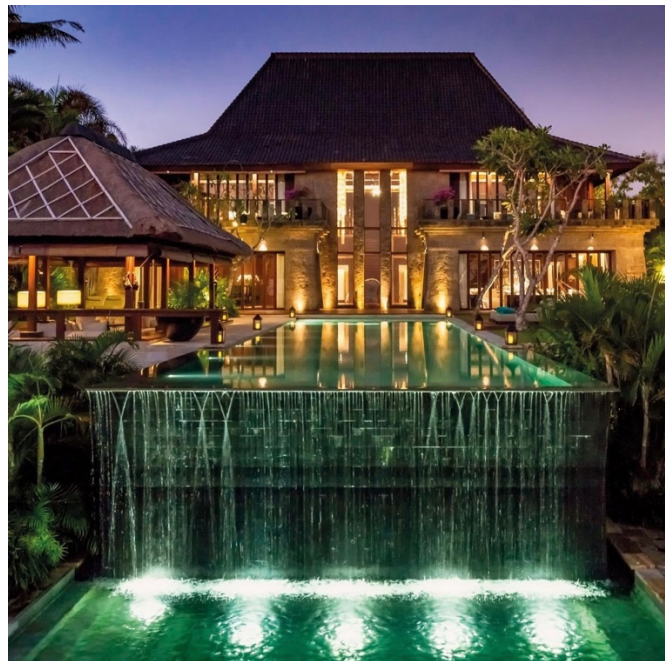
Gambar 1.1 Bulgari Resort Bali

Bulgari Resort Bali merupakan properti kedua dari Bulgari Hotels and Resort yang diresmikan buka pada 21 September 2006. Bulgari Resort Bali terletak di salah satu tujuan paling eksklusif di dunia, lambing nyata dari eksotisme tropis Timur, menggabungkan keindahan alam pantai Bali yang belum terjamah dengan desain kontemporer menawan yang lahir dari perpaduan antara kebudayaan Bali tradisional dengan gaya Italia yang superior. Kualitas layanan serta pemandangan Samudra Hindia yang ditawarkan dan letaknya yang berada 150 meter di atas laut, menjadikan Bulgari Resort Bali tempat yang sempurna untuk menjadi hotel kedua dari kelompok hotel Bulgari Hotel & Resort.