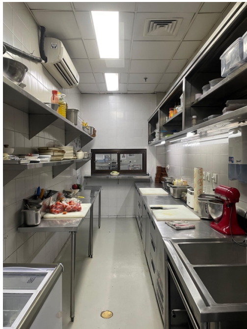
Gambar 1.10 Cold section