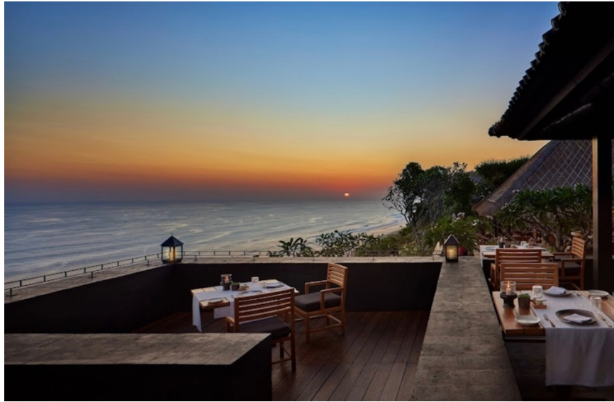
Gambar 1.3 View Sangkar Restaurant

IL Ristorante ditunjuk sebagai restoran hotel terbaik di dunia oleh forum makanan dan minuman internasional. 10 restoran hotel terbaik tahun 2011 oleh Villeroy & Boch 2013. IL Ristorante memiliki gaya bale terbuka yang berlokasi di atas tebing Pecatu yang memiliki panorama Indian Ocean yang indah, dibuka pada malam hari mulai pukul 18:30 – 23:00, dengan kapasitas hanya sampai 36 orang. Restoran ini menyajikan Contemporary Interpretation of Classical Italian Cuisine , yang dimasak dan diplating oleh Italian Chef yang sudah berpengalaman.