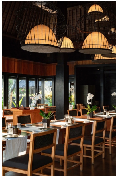
Gambar 1.2 Sangkar Restaurant

Bulgari Resort Bali terdapat 3 restaurant dan 1 bar, Sangkar restaurant, IL Ristorante, La Spiaggia dan The Bar. Sangkar restaurant posisi tepat di tepi tebing namun tetap elegan dengan suasana informal dimana restoran ini memiliki view yang indah, menghadap langsung ke Samudra Hindia. Sangkar restoran menggunakan nama Sangkar karena interior yang digunakan didalam restaurant ini berupa sangkar yang digunakan untuk burung di Bali. Restaurant ini buka dari pukul 06:30 – 22:00 dan menawarkan masakan khas internasional yang dipadukan secara kreatif, masakan khas Indonesia dengan teknik kuliner kekinian.