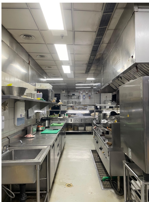
Gambar 1.12 Asian section