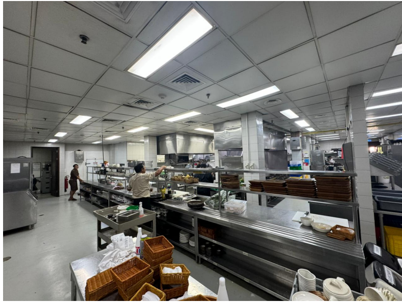
Gambar 1.9 Main Kitchen