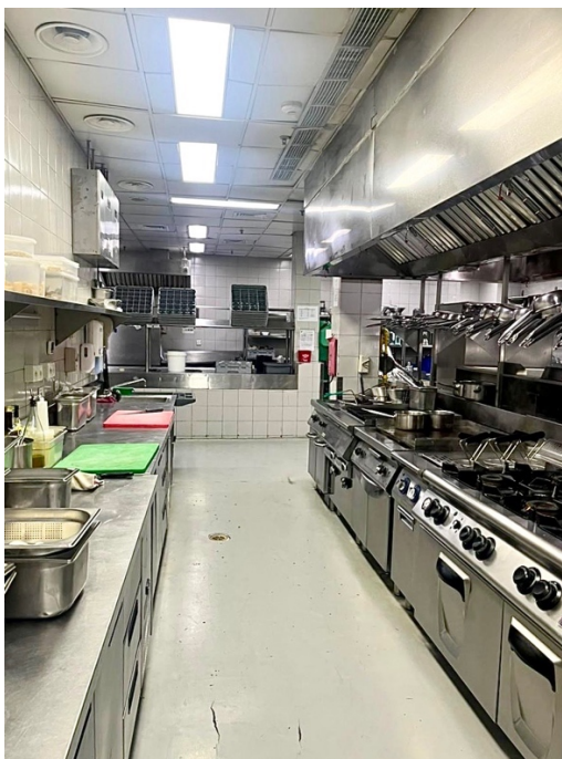
Gambar 1.11 Western section