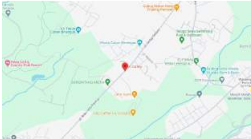
Gambar 1.2.1. 1 Peta Lokasi Hotel K Gallery

dikarenakan letak hotel yang masih asri alamnya. Lokasinya juga tepat karena letaknya diantara pusat kota Pandaan dan tempat wisata Tretes. Sehingga para pengunjung yang menginap disini dapat mudah untuk mengakses daerah kawasan Tretes maupun pusat kota.