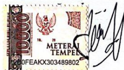
Maharani Dwi Pratiwi NIM: 21110028

Surabaya, 12 Januari 2024 Yang Menyatakan,