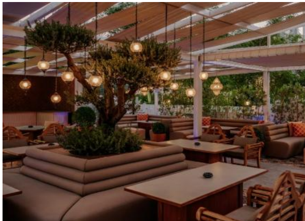
Gambar 1.11 Restoran View by Dusit

View by Dusit , Dinamakan demikian karena lokasinya yang strategis di antara gedung-gedung pencakar langit Dubai yang menjulang tinggi, View menawarkan pemandangan cakrawala yang indah. Puaskan selera Anda dengan beragam minuman lezat dan manjakan diri Anda dengan cita rasa Timur Tengah yang kaya dan beragam. Saksikan matahari terbenam ala Emirat, dengan shisha aromatik. Restoran View by Dusit , dipegang kendali oleh naungan Sous Chef Saurabh Ringola.