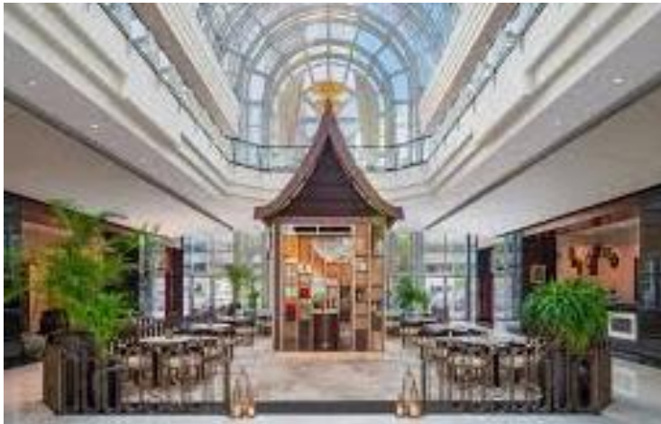
Gambar 1.14 Lobby Lounge Hotel Dusit Thani Dubai