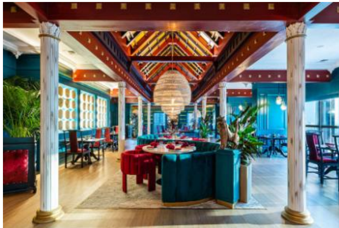
Gambar 1.5 BENJARONG