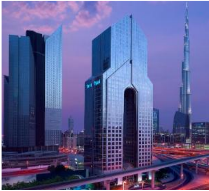
Gambar 1.13 Hotel Dusit Thani Dubai