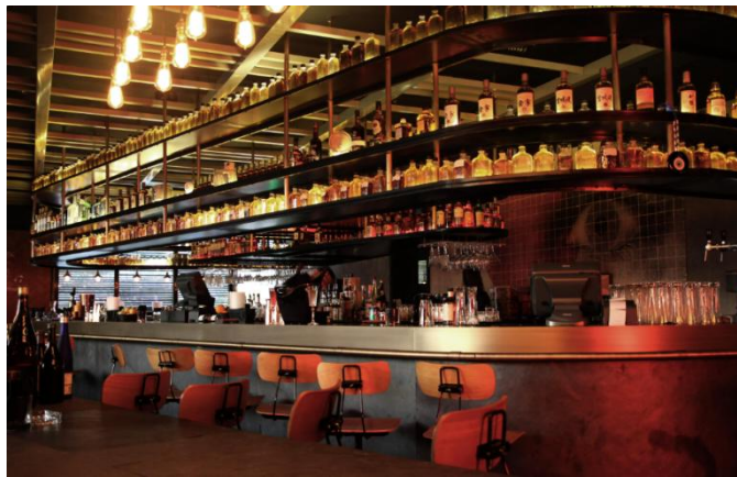
Gambar 1.7 MaKiRa Japanese Restaurant

Jones the Grocer , merupakan brand yang berasal dari Australia dengan penuh semangat yang berasal dari keinginan untuk menjalankan toko bahan makanan, kafe, dan ruang keju yang tidak konvensional. Toko ini merupakan yang pertama dari jenisnya yang menyajikan makanan artisan yang segar, sederhana, dan lezat, bersama dengan flat white terbaik bahkan sebelum ada. ( https://www.jonesthegrocer.com/our-story-i13? ).