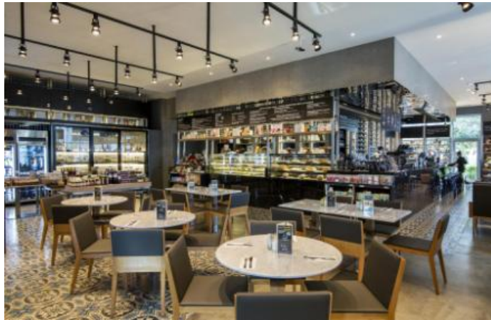
Gambar 1.8 Restoran Jones The Grocer