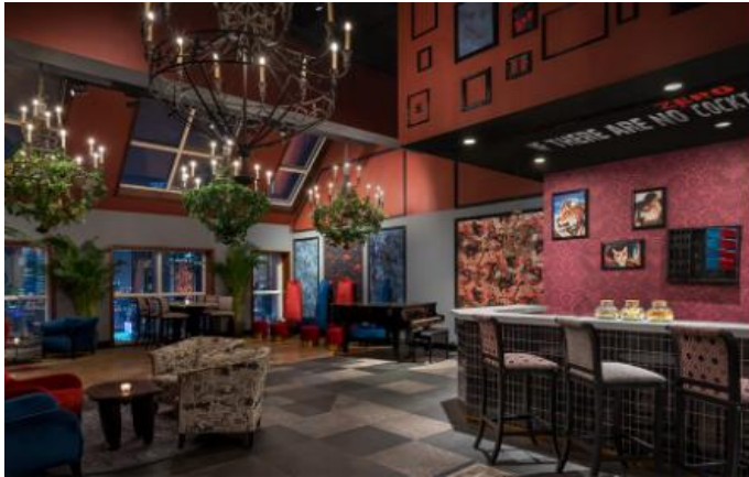
Gambar 1.10 NoLo

View by Dusit , Dinamakan demikian karena lokasinya yang strategis di antara gedung-gedung pencakar langit Dubai yang menjulang tinggi, View menawarkan pemandangan cakrawala yang indah. Puaskan selera Anda dengan beragam minuman lezat dan manjakan diri Anda dengan cita rasa Timur Tengah yang kaya dan beragam. Saksikan matahari terbenam ala Emirat, dengan shisha aromatik. Restoran View by Dusit , dipegang kendali oleh naungan Sous Chef Saurabh Ringola.