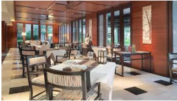
Gambar 1.1 Rin Restoran