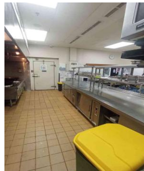
Gambar 1.3 Suku Kichen