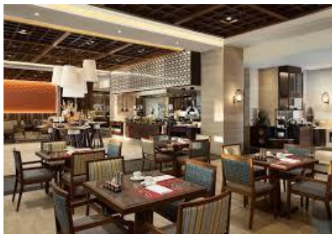
Gambar 1.2 Suku Restaurant

Suku Restaurant, yang berarti " golongan bangsa sebagai bagian dari bangsa yang besar", adalah restoran yang menyajikan masakan Indonesia autentik dari Sabang sampai Merauke. Restoran ini menawarkan berbagai hidangan dan cita rasa autentik termasuk masakan Bali, Batak, Minang, Sunda, dan Jawa, yang disajikan dengan gaya rijsttafel (menu dan layanan berbagi keluarga). Suku Restaurant juga mengadakan malam bertema setiap Sabtu dengan pertunjukan Kecak langsung. Kapasitas restoran ini adalah 180 kursi dan beroperasi dari pukul 07.00 - 22.00 WITA.