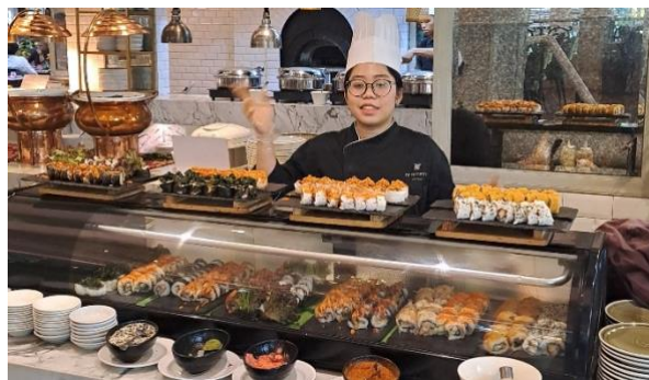
Gambar 2.1 Penulis incharge sushi section shift pagi

yang khusus diselenggarakan saat dinner selama bulan September sampai November, dengan menu Galbi pada flat top section . Awalnya, event ini direncanakan hanya sampai bulan Oktober, namun karena antusiasme dan reaksi positif dari tamu, maka event ini pun dilanjutkan sampai akhir bulan November. Menu Christmas , menggunakan menu makanan yang menggunakan produk roti. Menu ini digunakan selama bulan Desember, seperti Croque Monsieur , Foccacia , Creamy Shrimp Mini Hot Dog , Vol au Vent with Mushroom Ragout , Bahn Mi dan masih banyak lagi. Karena menggunakan banyak produk roti, penulis dan tim harus bekerja sama dengan tim Bakery dan berkomunikasi dengan baik agar mise en place berjalan dengan baik. Dan yang terakhir ialah event Chinese New Year , digunakan selama bulan Januari. Menu flattop section untuk event Chinese New Year ini ialah Chicken Bao Bun , Shanghai Burger , Jiaozi (Chinese dumpling) , dan Sesame Charcoal Bun .