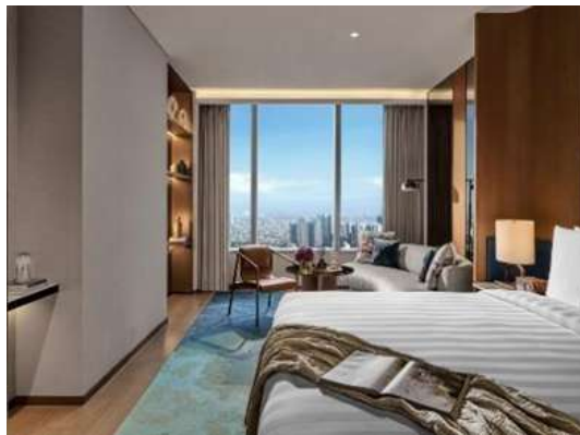
Gambar 1.8 Tipe Pacific Club Executive

Tipe kamar yang satu ini merupakan tipe yang lumayan besar dan nyaman untuk keluarga dengan besar 42 m 2 dengan harga Rp.2.924.017 dengan sarapan dan akses ke club lounge .