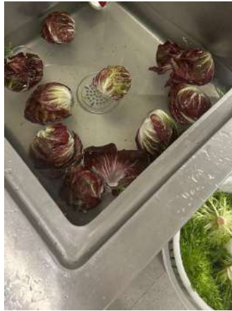
Gambar 2.6 Mencuci Lettuce