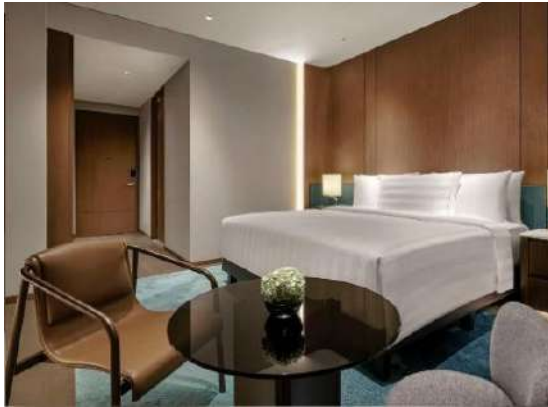
Gambar 1.3 Tipe Deluxe Room

Tipe Kamar ini merupakan tipe kamar yang paling murah diantara tipe kamar lainnya dengan memiliki fasilitas kamar luas 26-29 m 2 , Kasur king atau twin bed, pemandangan kota Jakarta. design dari kamar ini memiliki suasana modern dan elegan. Tipe kamar ini memiliki harga Rp. 2.000.000/malam.