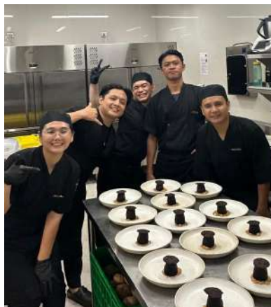
Gambar 2.56 foto bersama saat event 50 pax