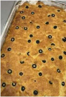
Gambar 2.24 membuat focaccia