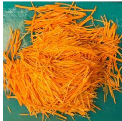
Gambar2.40 memotong wortel