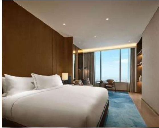
Gambar 1.10 Tipe Pan Pacific Suite

Pada tipe pan pacific suite ini juga belum resmi dibuka oleh hotel karna Pembangunan yang belum rampung, namun pada tipe ini memiliki kisaran harga hingga Rp. 5.000.000/ malam.