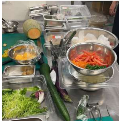
Gambar 2.1 membuat salad