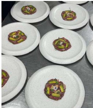
Gambar 2.54 tataki set menu