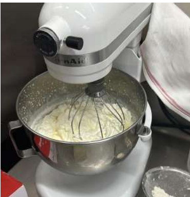
Gambar 2.27 butter cream