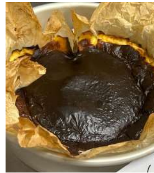
Gambar2.48 Burn cheesecake