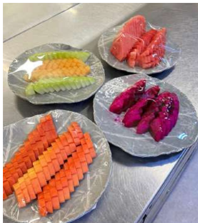
Gambar 2.2 Buah potong

Buah-buahan yang setiap harinya dipotong yaitu semangka, melon, papaya, nanas, dan juga terdapat beberapa buah kecil yaitu apel, jeruk, mangga, dan buah naga. Buah potong biasanya didisplay pada saat breakfast dan sore saat canape, oleh karena itu buah potong disiapkan pada sore hari sebelum pulang, dan juga pagi hari untuk stock malam