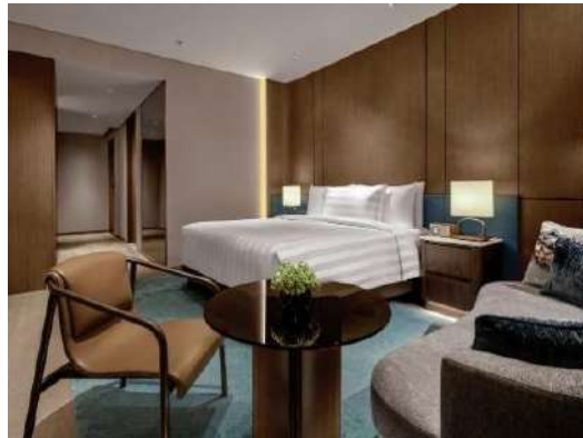
Gambar 1.4 Tipe Premier Room

Tipe kamar yang satu ini hampir sama dengan tipe kamar deluxe, yang membedakan kedua kamar ini yaitu luas kamarnya dengan besar 32 m 2 dengan harga Rp. 2.120.000/malam tanpa breakfast dan Rp. 2. 235.000/ malam dengan breakfast.