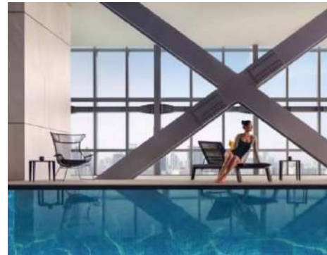
Gambar 1.12 Indoor Swimming Pool

Fasilitas gym dan kolam renang ini tersedia untuk seluruh tamu yang menginap di Pan Pacific dan juga Parkroyal Serviced Suites. Fasilitas ini terletak di lantai 71 dengan konsep indoor swimming pool dikarenakan kurang memungkinkan untuk kolam renang berada di outdoor pada lantai tinggi 71.