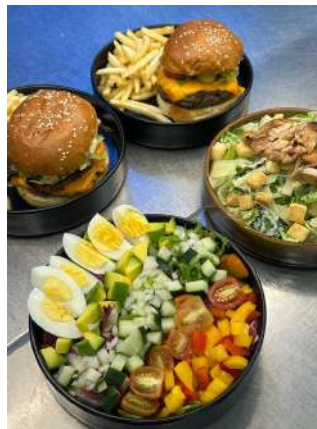
Gambar 2.12 Orderan Eden Bar

Orderan dari eden bar biasanya dimulai pada pukul 13.00 hingga 16.00. menu yang disediakan berbagai macam, mulai dari salad, minuman serta makanan berat.