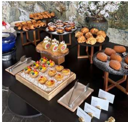
Gambar 2.34 Set-Up Brunch