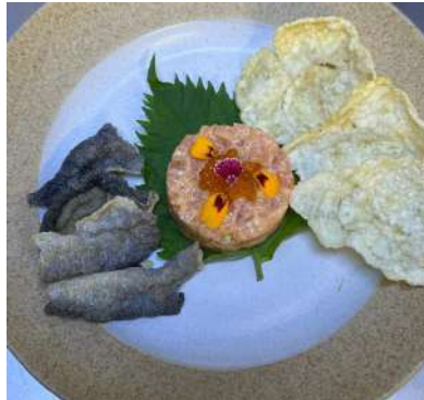
Gambar 2.43 salmon tartar