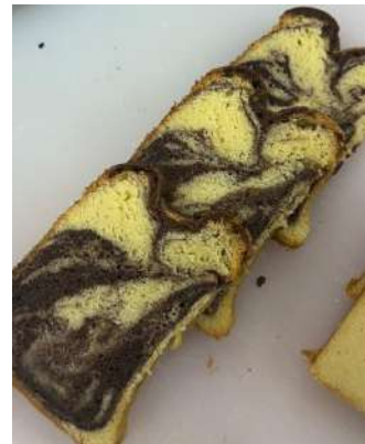
Gambar 2.30 marble cake