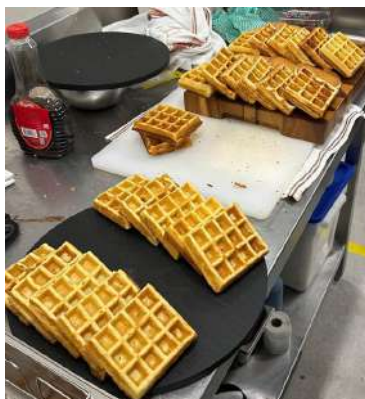
Gambar 2.20 Waffle