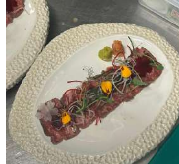
Gambar 2.46 Wagyu Tataki