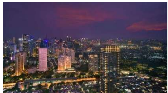
Gambar 1.15 City Light from 90 th floor

Keyaki Japanese restaurant terletak persis di sebelah Eden Bar yang sama berada letaknya di lantai 90. Keyaki restaurant juga digunakan sebagai tempat breakfast untuk tamu Pan Pacific dan untuk Park Royal Serviced Suite breakfast di residence lounge . Breakfast para tamu dimulai dari pukul 06.00-10.30 dan