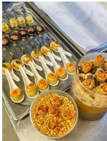
Gambar 2.7 membuat canape

Membuat canape dilakukan 2 hari pertama ketika awal masuk, setiap hari canape yang dibuat berbeda dan bervariasi. Dimulai pada pukul 18.00 pm – 20.00 pm.