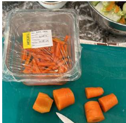
Gambar 2.11 pickle carrot