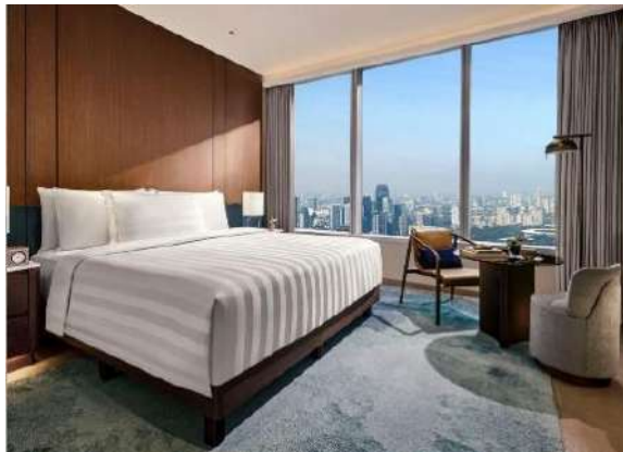
Gambar 1.6 Tipe Pacific Club Deluxe

Tipe kamar yang satu ini memiliki luas sebesar 28m 2 dengan harga Rp 2.695.180/ malam. Pada tipe kamar yang satu ini memiliki kelebihan bisa mengakses club lounge untuk bisa menikmati afternoon tea yang disediakan oleh hotel.