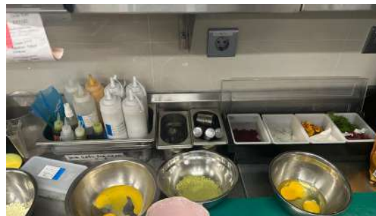
Gambar 2.36 settingan table cold kitchen