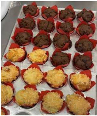
Gambar 2.28 muffin