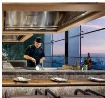
Gambar 1.14 Tepanyaki