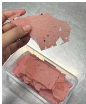
Gambar 2.47 dragon fruit tuile