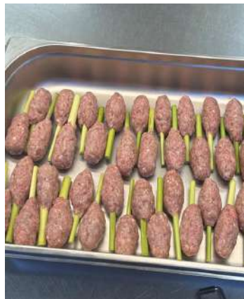
Gambar 2.14 membuat sate lilit

Ketika penulis sudah menyelesaikan tugasnya, penulis juga terkadang membantu section lain seperti pastry serta hot kitchen, supaya pekerjaan yang memiliki shift yang sama cepat selesai dan bisa pulang tepat waktu.