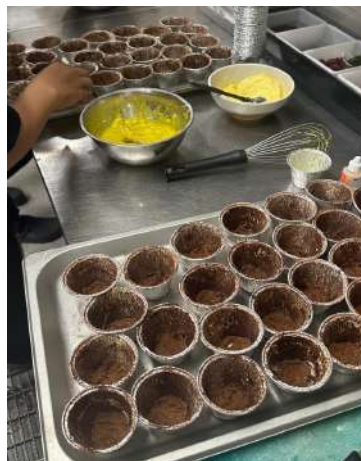
Gambar 2.39 Banana Cake