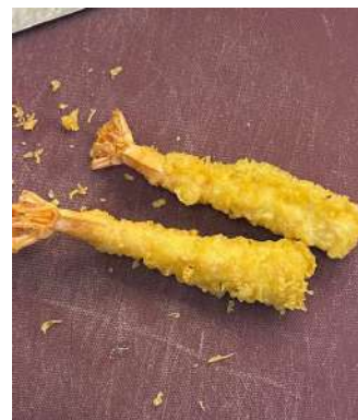
Gambar 2.52 Ebi tempura