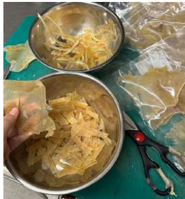
Gambar 2.37 memotong ehire

Mengecek semua barang ketersediaan untuk lunch dan dinner selagi menunggu orderan ala carte lunch seperti amazu konbu, jelly ajisai, white sesame sauce, yuzu onion dressing, yuzu mayo, spicy mayo, ponzu jelly, banana cake, matcha lava cake, mochi, creme brulee, condiment salad, dan lain sebagainya.