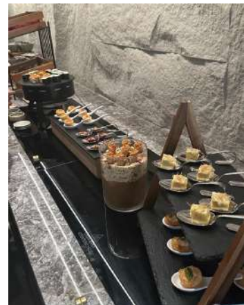
Gambar 2.8 set up canape di club