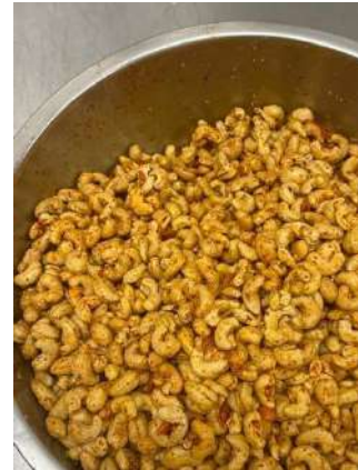
Gambar 2.17 kacang mede

b) Dari tanggal 9 September 2024 hingga 3 November 2024, penulis diletakkan di bakery pastry breakfast. Berikut job desc yang dilakukan oleh penulis: