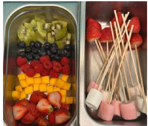
Gambar 2.33 Fruit Skewer