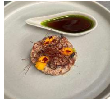
Gambar 2.42 tuna tar-tar