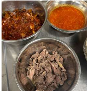
Gambar 2.9 Condiment