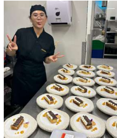
Gambar 2.55 dessert brioche