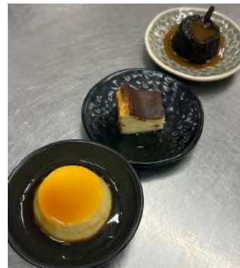
Gambar 2.50 R&D for buffet