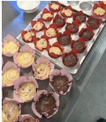
Gambar 2.16 membuat muffin