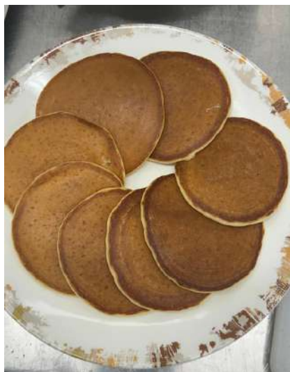
Gambar 2.18 pancake