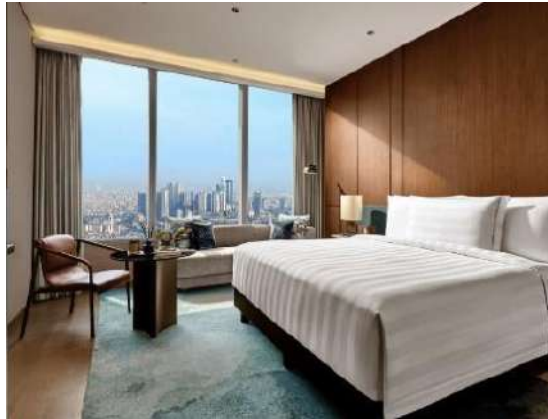
Gambar 1.7 Tipe Pacific Club Premier

Tipe kamar ini memiliki besar 32 m 2 dengan harga Rp. 2.809.598/malam yang sudah termasuk breakfast dan akses ke club lounge .