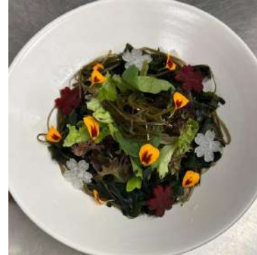
Gambar 2.44 wakame salad