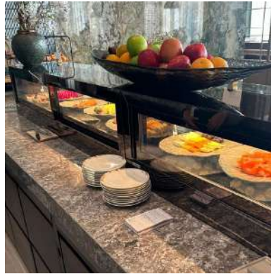
Gambar 2.3 buffet bagian dalam