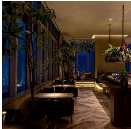
Gambar 1.13 Eden Bar

Eden bar merupakan salah satu bar tertinggi di Indonesia yang terletak di Thamrine Nine bersamaan dengan Pan Pacific Hotel. Eden Bar beroperasi setiap hari dari pukul 12.00-16.00 untuk lunch dan dilanjutkan pukul 17.00-00.00 untuk hari Senin sampai Kamis dan 17.00-01.00 untuk hari Jumat hingga Minggu. Bar ini tidak hanya menawarkan minuman alkohol dan non-alkohol namun juga set menu lunch dan dinner yang bisa dinikmati dengan pemandangan citylight dari lantai 90.