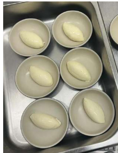
Gambar 2.19 quenelle cream