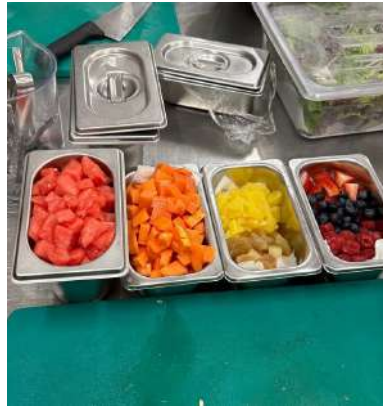
Gambar 2.13 condiment fruit bowl ala carte