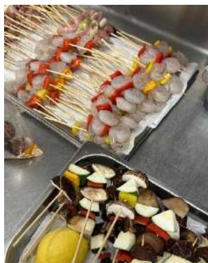
Gambar 2.51 Kushiyaki

Membantu membuat kushiyaki, memvakum salmon dan tajima, membuat orderan ebi tempura, dan lain sebagainya