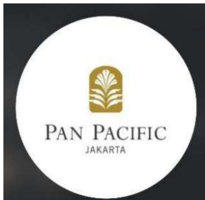
Gambar 1.1 Logo Hotel