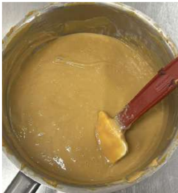
Gambar 2.29 membuat kaya jam