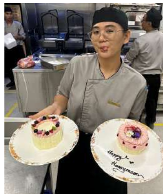
Gambar 2.23 complimentary cake