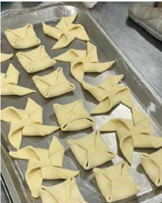
Gambar 2.25 Puff pastry shapes