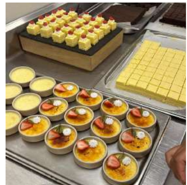
Gambar 2.31 Slice cakes