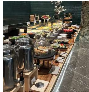
Gambar 2.4 buffet bagian depan