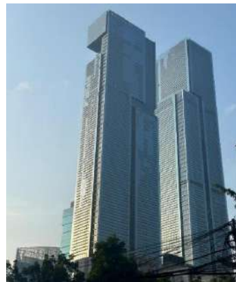
Gambar 1.2 Gedung Hotel

Pan Pacific Hotel and Resort merupakan salah satu hotel tertinggi di Indonesia bahkan di south asia yang tingginya hingga 90 lantai, hotel ini merupakan hotel baru di Jakarta yang baru dibuka pada 1 Juni 2024. Pan pacific dan park royal hotel memiliki kepemimpinan yang sama yaitu dibawah naungan UOL Group. Pada tahun 1962, dibangun park royal pertama di Melbourne yang dilanjutkan pada tahun 1986 untuk Pembangunan Pan Pacific [a2] di Singapore setelah itu Pan pacific mulai mendunia dan mulai membuka cabang di beberapa negara di dunia