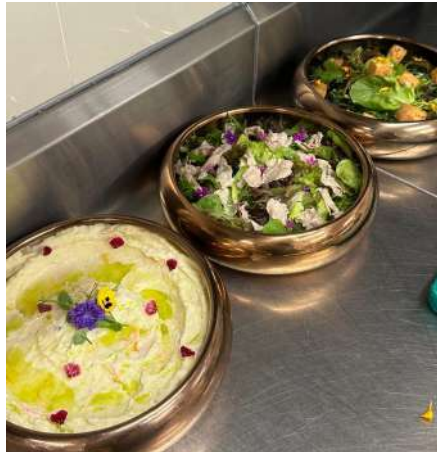
Gambar 2.53 salad untuk brunch