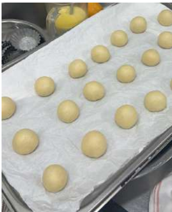
Gambar 2.26 membuat donat