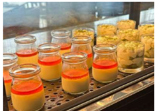
Gambar 2.35 Purin

c) Pada tanggal 4 November 2024 penulis dirolling posisi di tempat Japanese Dinner Keyaki hingga 15 Januari 2025, job desc yang dilakukan oleh penulis yaitu