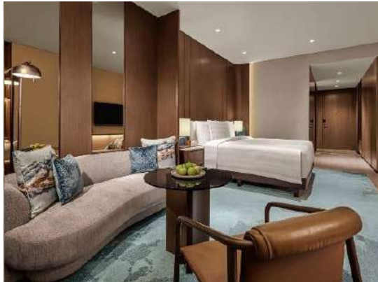
Gambar 1.5 Tipe Executive Room

Tipe kamar ini memiliki luas 42m 2 dengan harga per malamnya Rp2.232.701 tanpa breakfast dan Rp. 2.351.926 dengan breakfast.