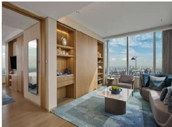
Gambar 1.9 Tipe Premier suite

Tipe yang satu ini belum resmi dibuka oleh pan pacific, namun tipe ini merupakan tipe yang lebih bagus dari pada tipe junior suite.