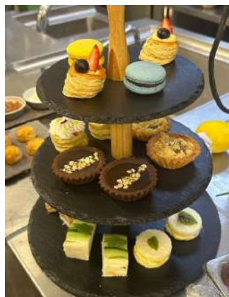
Gambar 2.5 Tier Afternoon tea

afternoon tea dimulai pada jam 12.00 hingga pukul 16.00. afternoon tea di club biasanya menggunakan tier untuk disajikan ke tamu dan didalamnya mencakup makanan ringan dari tim pastry dan juga dari cold kitchen