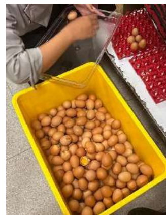
Gambar 2.15 mengangkat telur