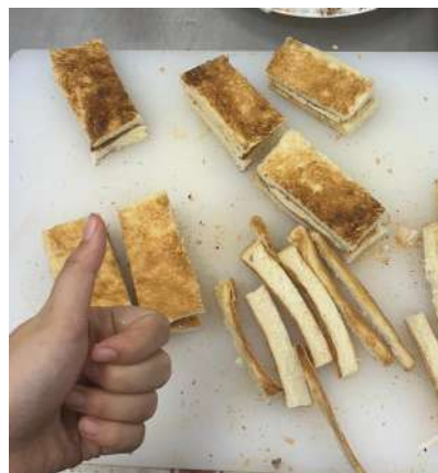
Gambar 2.21 Kaya Toast