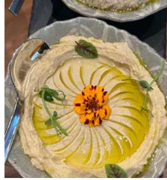
Gambar 2.10 Membuat Hummus