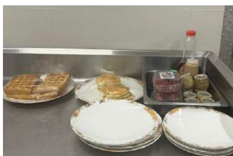
Gambar 2.22 Set-up Table untuk orderan alacarte