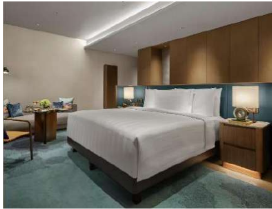
Gambar 1.8 Tipe Junior Suite

Tipe ini merupakan ini yang saat ini paling besar dan paling mahal di pan pacific Jakarta dengan ukuran luas 55 m 2 . Dengan akses seperti 2 tipe kamar sebelumnya. Pada tipe junior suite ini memiliki harga 3.382.125/malam.