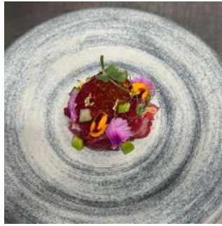
Gambar 2.41 Dashi jelly