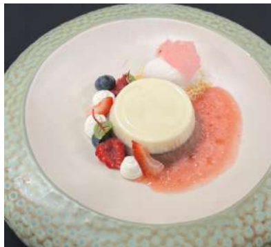
Gambar 2.49 Pannacota valentine