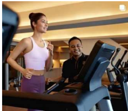
Gambar 1.11 Fasilitas Gym