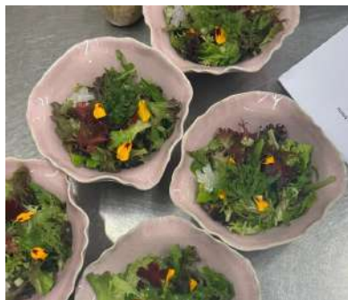
Gambar 2.45 salad lunch set