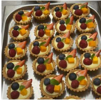
Gambar 2.32 Fruit Tartlet