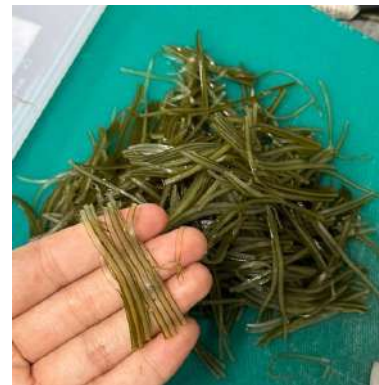
Gambar 2.38 amazu konbu