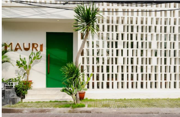
Gambar 1.1 Mauri Restaurant