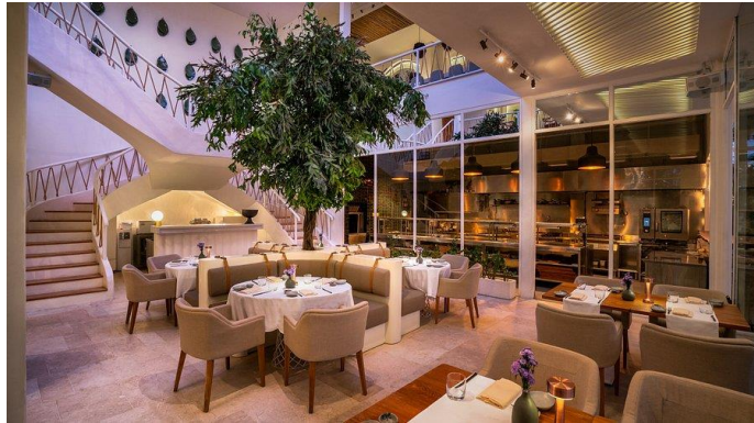
Gambar 1.2 Isi Mauri Restaurant