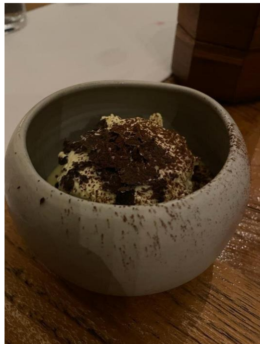
Gambar 1.3 Makanan di Mauri Restaurant ( Filleteo di Manzo dan Tiramisu )