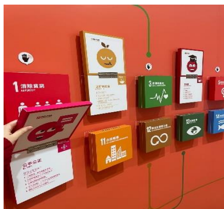
Gambar 2.12 Pameran Interaksi