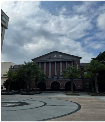
Gambar 2.14 Minghsin University