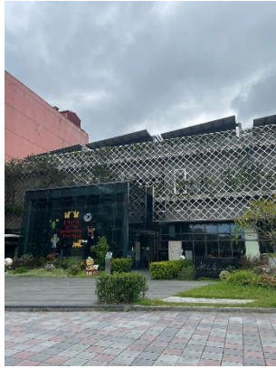
Gambar 2.2 Kuo Yuan Ye