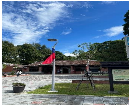
Gambar 2.9 Cihu Mausoleum

Kunjungan ke Cihu Mausoleum menambah wawasan mengenai negara Taiwan. Selain itu, menambah pengetahuan mengenai sejarah negara Taiwan dan presiden pertama Taiwan. Sages International Industrial Visit ini bukan hanya diperlihatkan restoran yang ada di Taiwan, namun juga memperlihatkan representasi negara Taiwan itu sendiri.