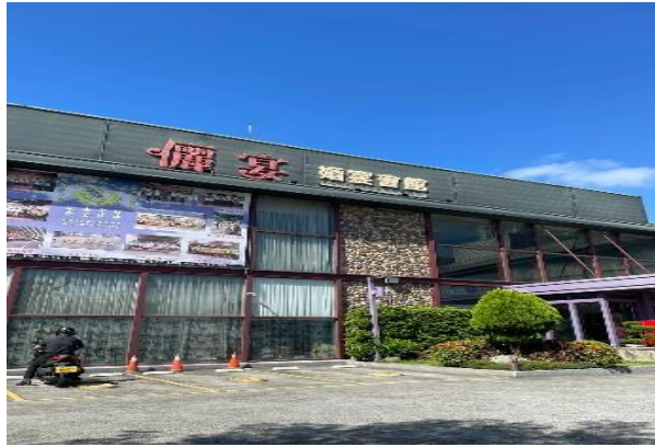
Gambar 2.1 Li Yuan Restaurant