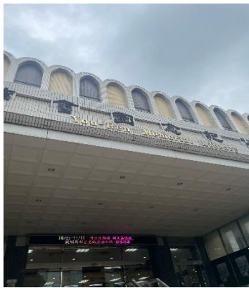
Gambar 2.16 You-Ren Library