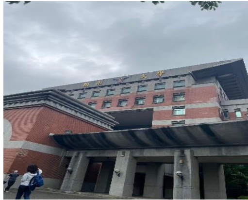
Gambar 2.18 Kainan University

Kainan University memiliki banyak jurusan dan program yang menarik. Salah satu program yang dapat diterapkan di Akademi Sages adalah program student exchange . Program ini dapat menambah wawasan mahasiswa mengenai budaya diluar, menambah koneksi, dan memperkenalkan nama Akademi Sages secara luas.