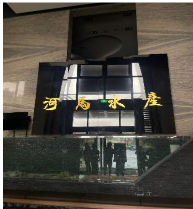
Gambar 2.6 Toko Ritel He Ma Shui

He Ma Shui Restaurant merupakan satu-satunya restoran seafood yang dikunjungi selama kegiatan Sages International Industrial Visit . Uniknya, mereka mempunyai toko ritel kecil di dalam restoran tersebut. selain itu, mereka memiliki kompor listrik di setiap meja makan untuk merebus hidangan laut.