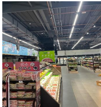
Gambar 2.5 He Ma Shui