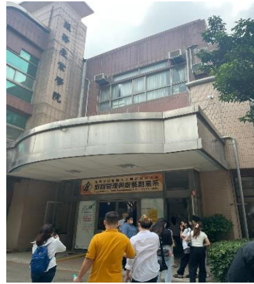
Gambar 2.15 Gedung Perhotelan