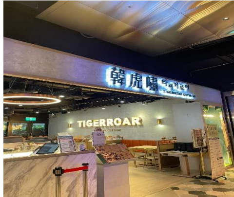
Gambar 2.7 Tiger Roar Express