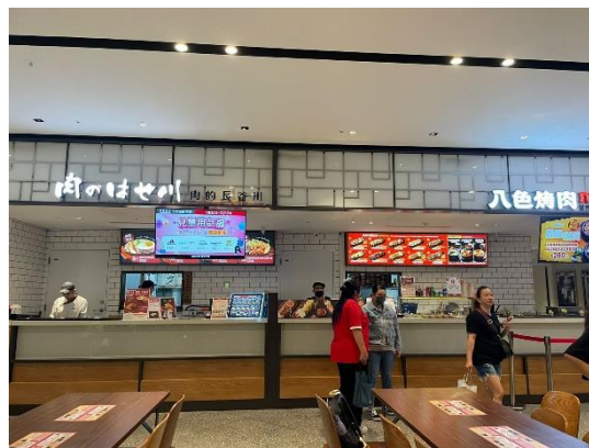
Gambar 2.8 Palsiq Restaurant

Mengunjungi Palsiq Restaurant menunjukkan proses persiapan, dan pengerjaan di tempat makan food court . Pekerjaan yang dilakukan karyawan restoran food court berbeda dengan yang dilakukan karyawan di restoran besar. Hal ini dapat dijadikan pertimbangan jika ingin membuka restoran di food court .