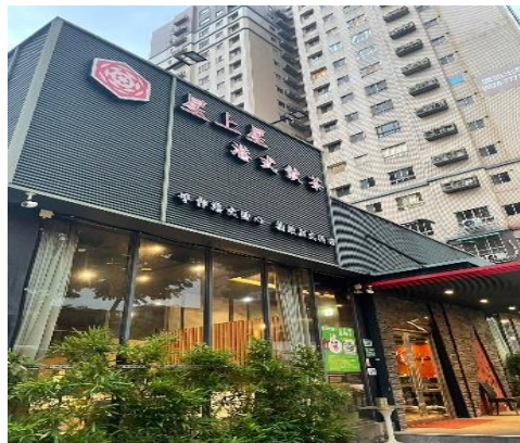
Gambar 2.4 Kanton Restaurant

Di Kanton Restaurant terdapat beberapa mahasiswa dari Indonesia yang sedang melakukan internship . Mereka berkata membutuhkan waktu 6 (enam) bulan agar mereka dapat diterima dari pemerintahan Taiwan dan berangkat internship . Menyimpulkan bahwa semua mahasiswa yang ingin internship di negara Taiwan membutuhkan waktu yang lama untuk diterima, jadi sebaiknya mulai didaftarkan sedini mungkin.