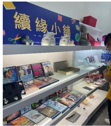
Gambar 2.17 Pojok Barang Bekas