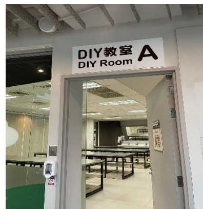
Gambar 2.13 DIY Room